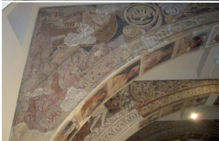
Figura 3. Pintures murals dels Sants Joan i Bartomeu de l'absis de l'església de Sant Serni de Baiasca —segle XII— (esquerra). Detall del dibuix preliminar del cap i del nimbe de Sant Climent —fragments conservats in situ a l'església de Sant Climent de Taüll, segle XII— (superior dreta). Pintures de la Sala Capitulare de Santa Maria de Sixena —c. 1200—, transformades per l'incendi, arrencades i conservades al MNAC (inferior dreta).