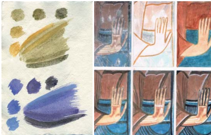
Figura 1. Sistema de construcció de la pintura segons el tractat medieval de Theophilus, capítol XIV (esquerra). Seqüència de les fases de realització de la pintura mural: detall de la mà d'una de les figures de les pintures murals de Sant Serni de Baiasca (dreta).

D'altra banda, els mètodes d'anàlisi s'han centrat en l'estudi directe dels materials i dels procediments dels diversos conjunts murals medievals. L'estudi i la documentació de les característiques tècniques de l'obra s'ha dut a terme desenvolupant una estratègia i un protocol d'anàlisi de la pintura. La identificació dels materials s'ha efectuat a partir de l'extracció i l'observació de seccions estratigràfiques de la pintura amb microscòpia òptica (Figura 2. Gasol, 2012) i s'han realitzat anàlisis instrumentals dels pigments, colorants i matèries orgàniques, mitjançant la Microscòpia Electrònica de Rastreig (SEM/EDX), Reflectografia d'Infraroig (FTIR) i Difracció de Raig X (XRD).