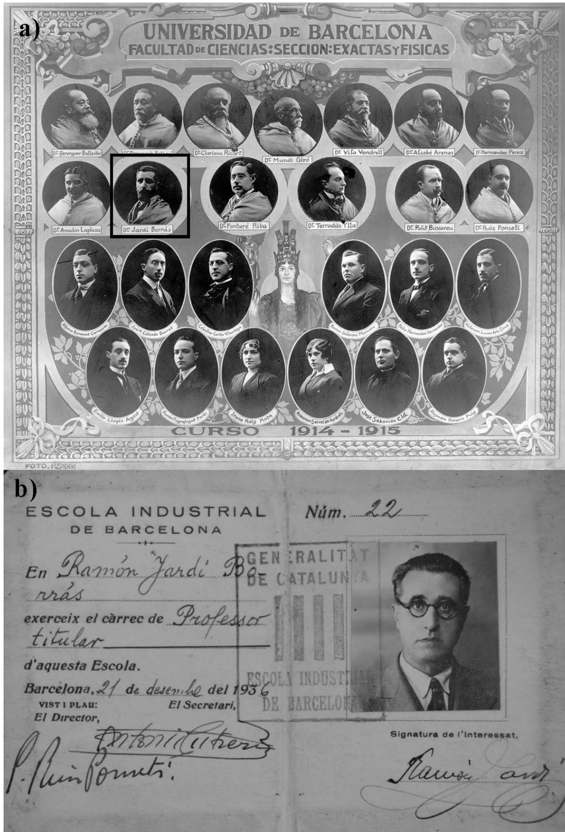
Figura 3. Orla de la Facultad de Ciencias de la Universidad de Barcelona de la promoción 1914-1915 (a) y documento acreditativo como Profesor Titular de la Escuela Industrial de Barcelona del año 1936.