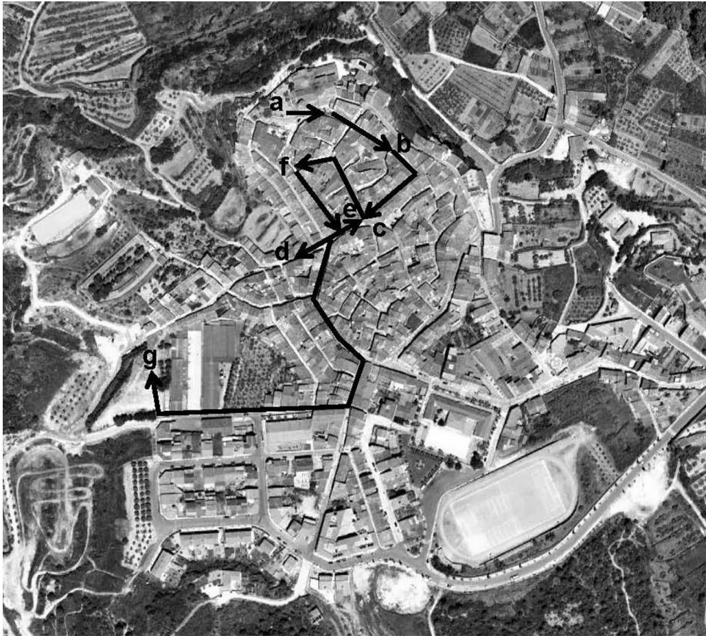
Figura 1. Propuesta de itinerario turístico por el núcleo urbano de Tivissa.