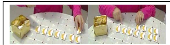
Figura 5 – Categoria “Correspondência termo a termo”. Figura 6 - Categoria “Correspondência Separando”.

A categoria “ Correspondência Juntando ” foi criada para contemplar os casos em que, para resolver problemas de Relação Estática Ligando Duas Medidas, a criança estabelece a correspondência um-a-um entre os dois conjuntos e adiciona a diferença ao segundo conjunto, sendo a resposta encontrada pela quantidade do conjunto maior. No problema “A Maria tem 3 flores. A Rita tem mais 2 do que a Maria. Quantas flores tem a Rita?”, por exemplo, a criança coloca três flores que correspondem à quantidade mencionada de um dos conjuntos e coloca um outro conjunto de flores por cima do primeiro, em correspondência um-a-um e adiciona a este último mais duas flores, que corresponde à diferença entre os conjuntos, contando de seguida as flores que estão no conjunto maior (ver Figura 7).