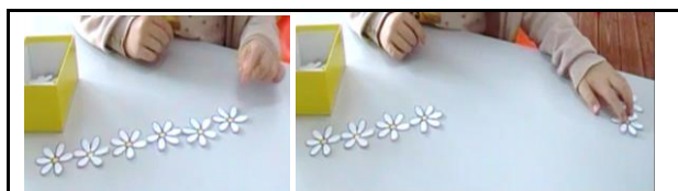
Figura 3- Categoria “Separar De”

Na estratégia “ Separar Para ” a criança faz o conjunto maior dito no enunciado e retira os elementos necessários até deixar ficar a quantidade menor mencionada no problema. A resposta é encontrada pela quantidade que foi retirada, como, por exemplo, no problema “A mãe do Pedro fez 7 bolos para a festa. O Pedro comeu alguns em segredo e agora a mãe só tem 4 bolos para pôr na mesa. Quantos bolos comeu o Pedro?”, a criança coloca um conjunto de 7 bolos (ver Figura 4), a quantidade maior mencionada no problema, e retira os elementos necessários para que fiquem apenas quatro bolos, a quantidade menor mencionada, contando de seguida os bolos que retirou.