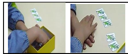
Figura 2 - Categoria “Juntar Para”