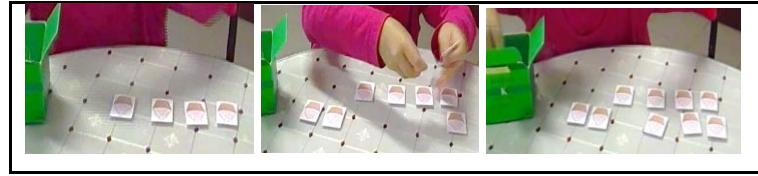
Figura 9 - Categoria “A-Mais Correspondência”

As estratégias de manipulação direta usadas pelas crianças parecem variar, não de acordo com a idade, mas sobretudo consoante o tipo de problemas. Nos três grupos etários, as crianças recorrem à mesma variedade de estratégias, escolhendo estratégias diferentes de acordo com o tipo de problemas que pretendem resolver. Verifica-se também que as estratégias de correspondência são apenas usadas nos problemas de Relação Estática Ligando Duas Medidas, em que manipulam dois conjuntos distintos, estabelecendo, de alguma forma, uma correspondência entre ambos, enquanto que nos problemas de Composição de Duas Medidas e Transformação Ligando Duas Medidas a manipulação é feita num só conjunto, no qual juntam ou separam elementos.