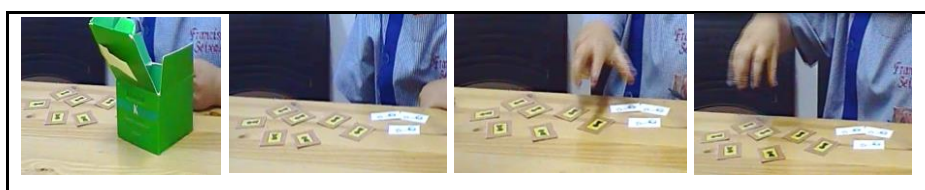
Figura 8 - Categoria “Correspondência Para”

A categoria “ Correspondência Para ” foi criada tendo sido observado casos em que a criança coloca os dois conjuntos mencionados no problema, mas sem estabelecer a correspondência um-a-um. No segundo conjunto, a criança conta a quantidade mencionada no primeiro conjunto, ou seja, o mesmo número de elementos do primeiro conjunto e retira o excedente, contando quantos elementos retirou. No problema “ Numa casa há 7 portas e 3 chaves. Quantas portas há a mais do que chaves? ”, por exemplo, a criança coloca sete portas e três chaves, correspondentes aos dois conjuntos mencionados no problema, de seguida conta três portas, correspondente ao número existente de chaves e conta as portas que restam, não estabelecendo para tal correspondência um-a-um (ver Figura 8).