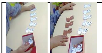
Figura 1 - Categoria “Juntar Tudo”