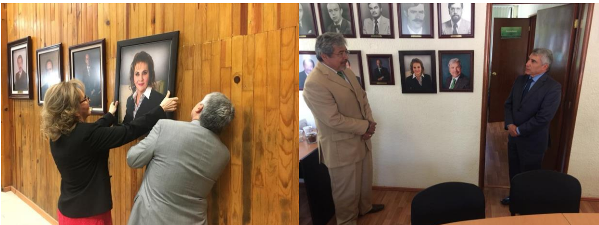
IMAGEN 3 COLOCACIÓN DE LAS FOTOGRAFÍAS DE LOS EXDIRECTORES.