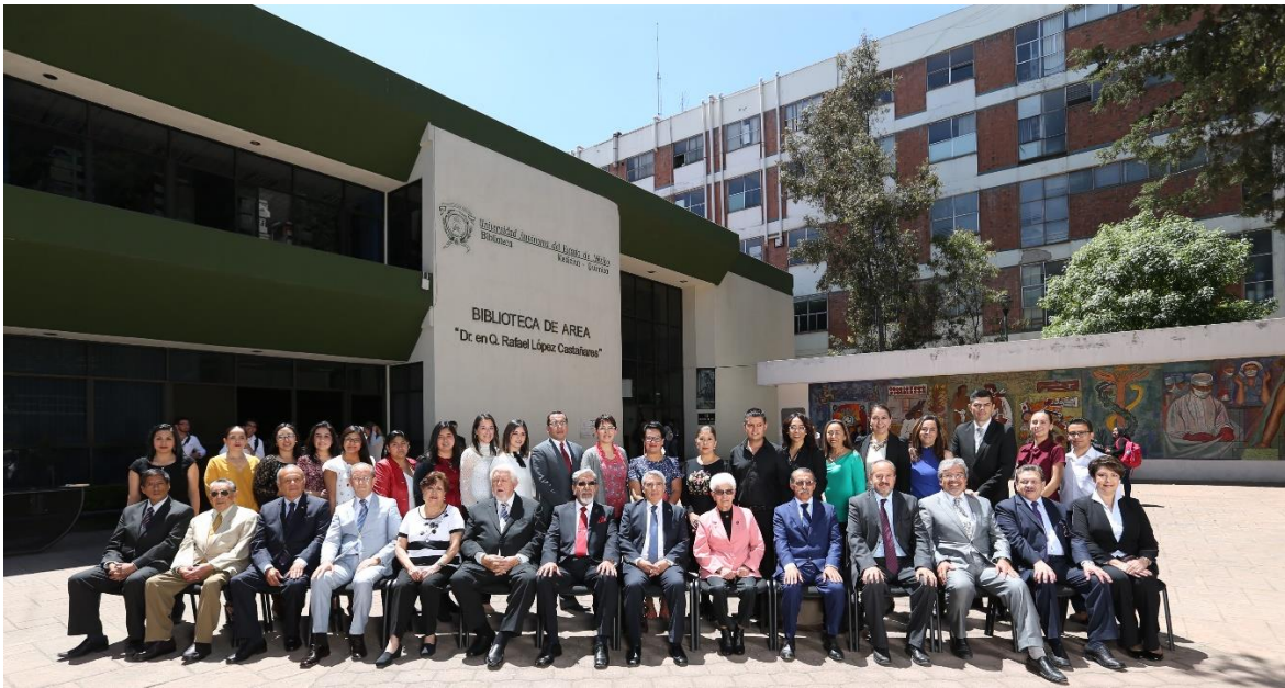
Imagen 10 Foto Conmemorativa al 63 Aniversario, director de la Facultad, exdirectores, primeros coordinadores de licenciatura y primera generación de Medicina, Nutrición, Terapia Física, Terapia Ocupacional y Bioingeniería Médica.