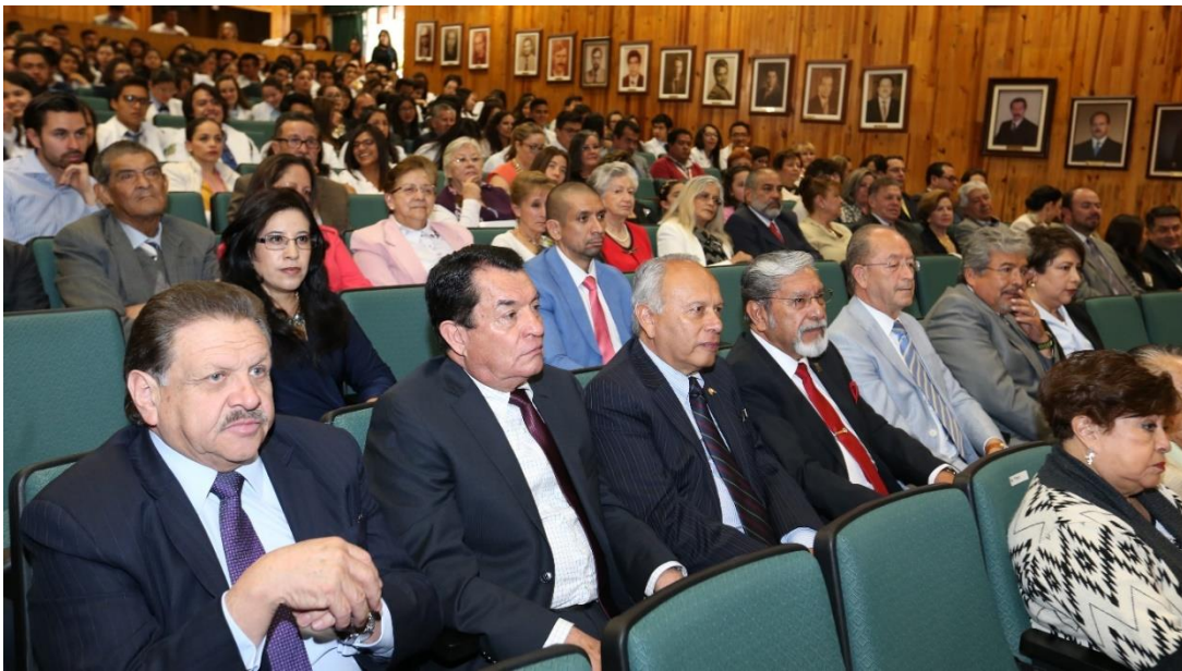
Imagen 5 Invitados a la Ceremonia de Clausura, exdirectores, directores de hospitales, egresados de la primera generación de las cinco licenciaturas, alumnos, administrativos, docentes y familiares de los fundadores. Acervo de la Facultad de Medicina.

En este magno evento, tuvimos el privilegio de contar con la asistencia de los directores de Química, Medicina Veterinaria y Zootecnia, Odontología, y Enfermería y Obstetricia, instituciones con quienes, en algún momento de la historia, compartimos tronco común e instalaciones en el extinto Instituto de Ciencias de la Salud; así como de ex directores de nuestra Facultad, directores de hospitales, egresados de la primera generación de las cinco licenciaturas, familiares de los fundadores, docentes, maestros, administrativos y alumnos.