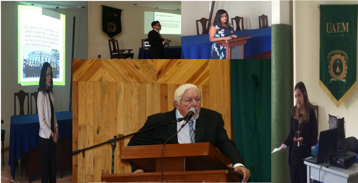
IMAGEN 2 EGRESADOS DE LA 1RA GENERACIÓN TERAPIA FÍSICA, BIOINGENIERÍA MÉDICA, TERAPIA OCUPACIONAL, MEDICINA Y NUTRICIÓN.