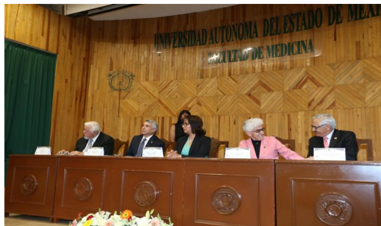
Imagen 4 Integrantes del Presídium de la Ceremonia de Clausura del 63 Aniversario.