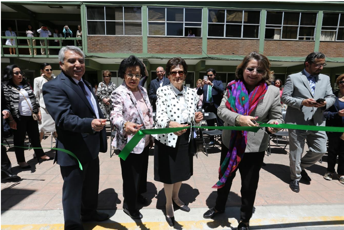
Imagen 9 Inauguración del Memorial a Fundadores.