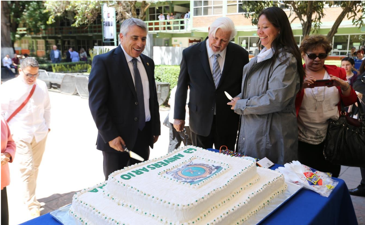
Imagen 11 Partida de Pastel del 63 Aniversario.

Estos festejos son el refrendo del compromiso social que tiene nuestra Universidad para realizar actividades de divulgación del conocimiento científico y de los resultados de la atención de los servicios que se ofrecen a la comunidad mexiquense.