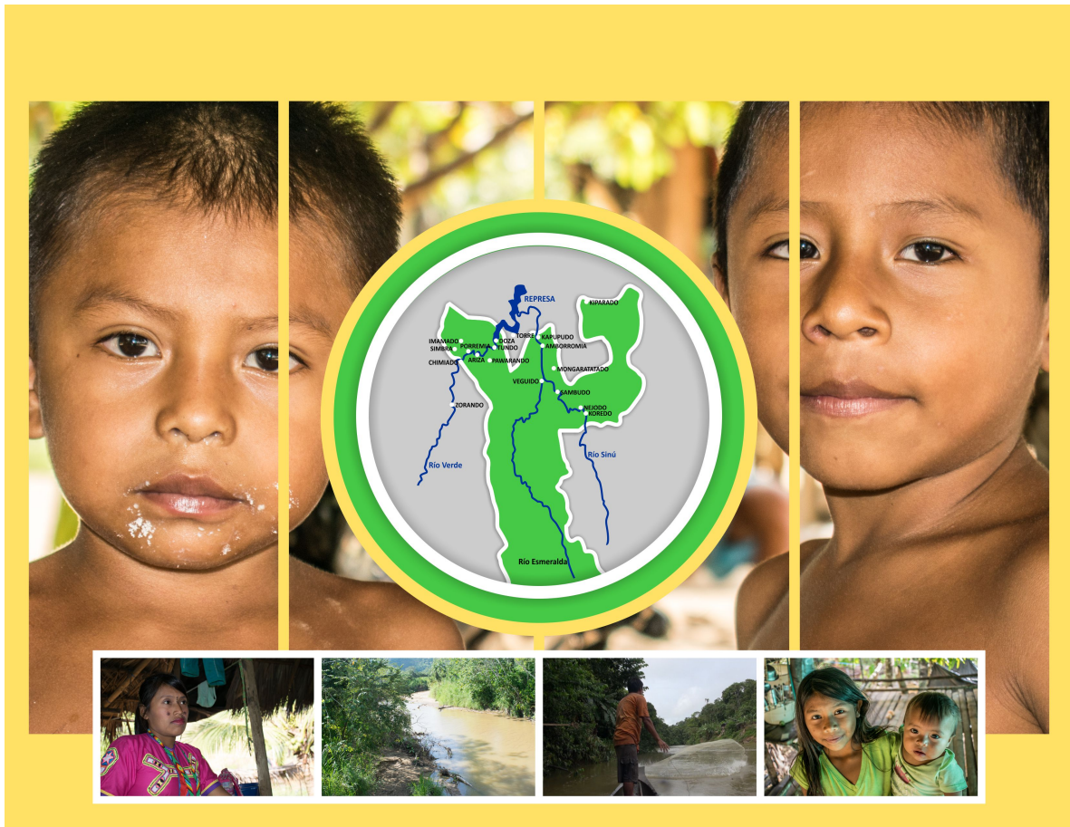
Imagen elaborada por el diseñador gráfico Juan Carlos Potes.