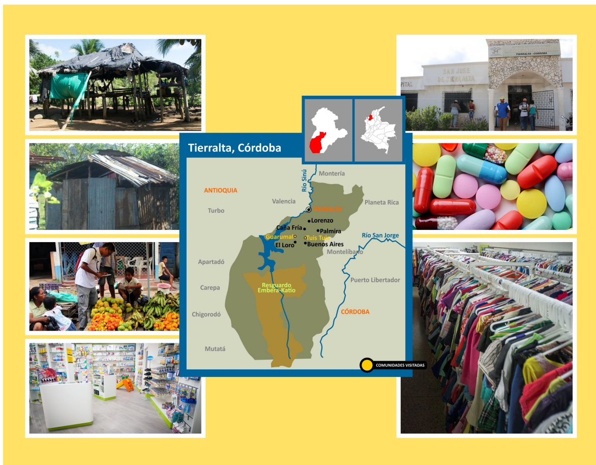
Mapa elaborado por el diseñador gráfico Juan Carlos Potes.

mostrado en “importancia territorial” y al que se mostrará a continuación para hacer un paralelo de los lugares donde residen actualmente las comunidades indígenas.