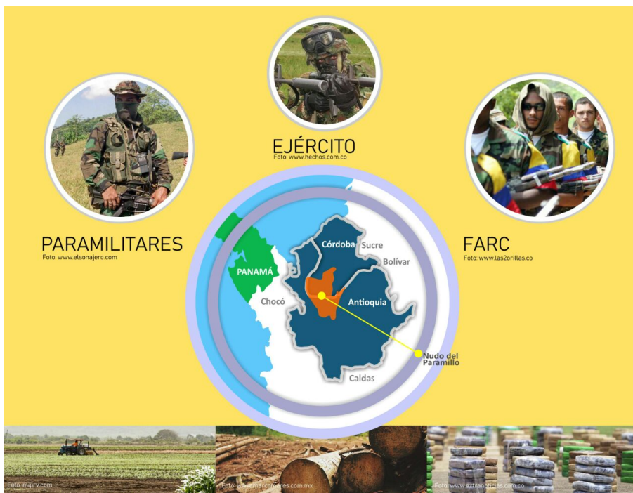
Imagen elaborada por el diseñador gráfico Juan Carlos Potes

Conflictos: Esta estación se realizará tal cual se viene desarrollando. Se describirán los tres conflictos -mencionados anteriormente- que afectaron a la comunidad Emberá Katío del Alto Sinú, y se mostrará el siguiente mapa para ejemplificar y explicar de forma dinámica y didáctica los acontecimientos históricos de dicho grupo étnico.