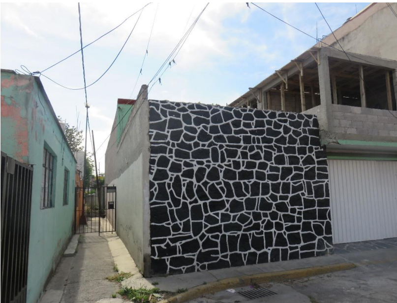
Imagen 6. Andadores cerrados con rejas, 15 de abril de 2016