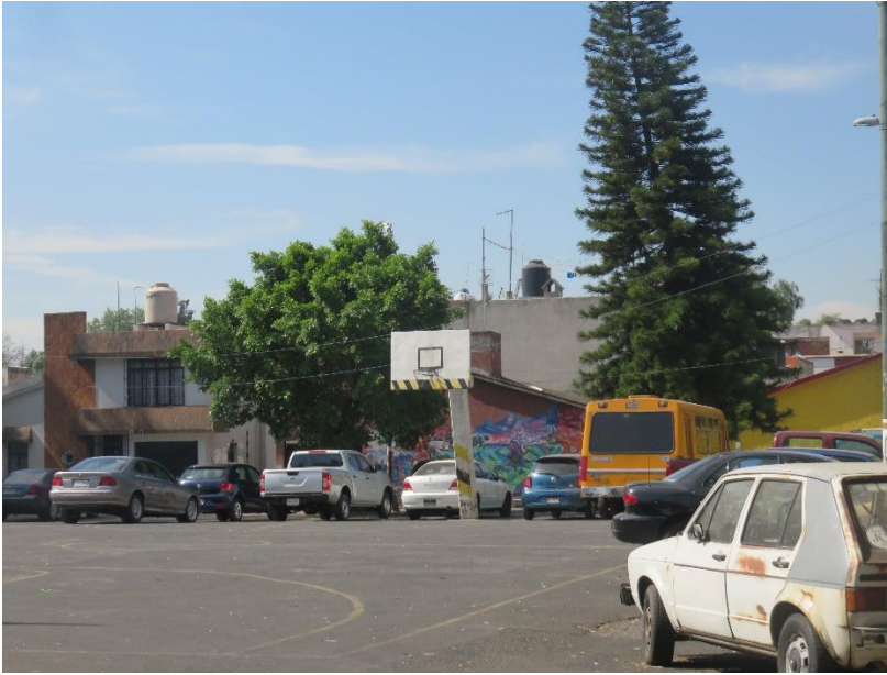
Imagen 5. Canchas deportivas usadas para los autos. 15 de abril de 2016.