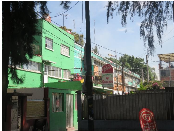
Imágenes 1 y 2. Edificio, 15 de abril de 2016; paisaje urbano, 15 de abril de 2016