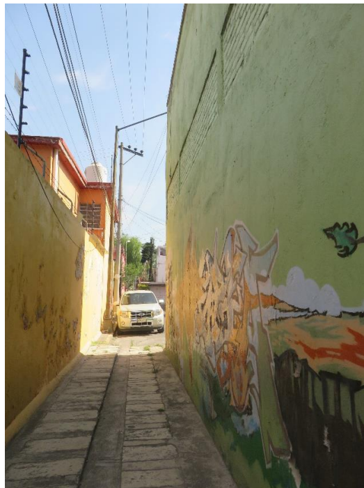
Imágenes 3 y 4. Andadores pequeños, 15 de abril de 2016.