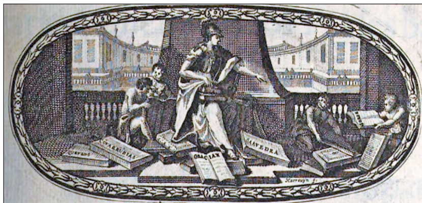
Figura 2: Gracián en el centro del Canon literario francés (Sobrino 1705: portada)