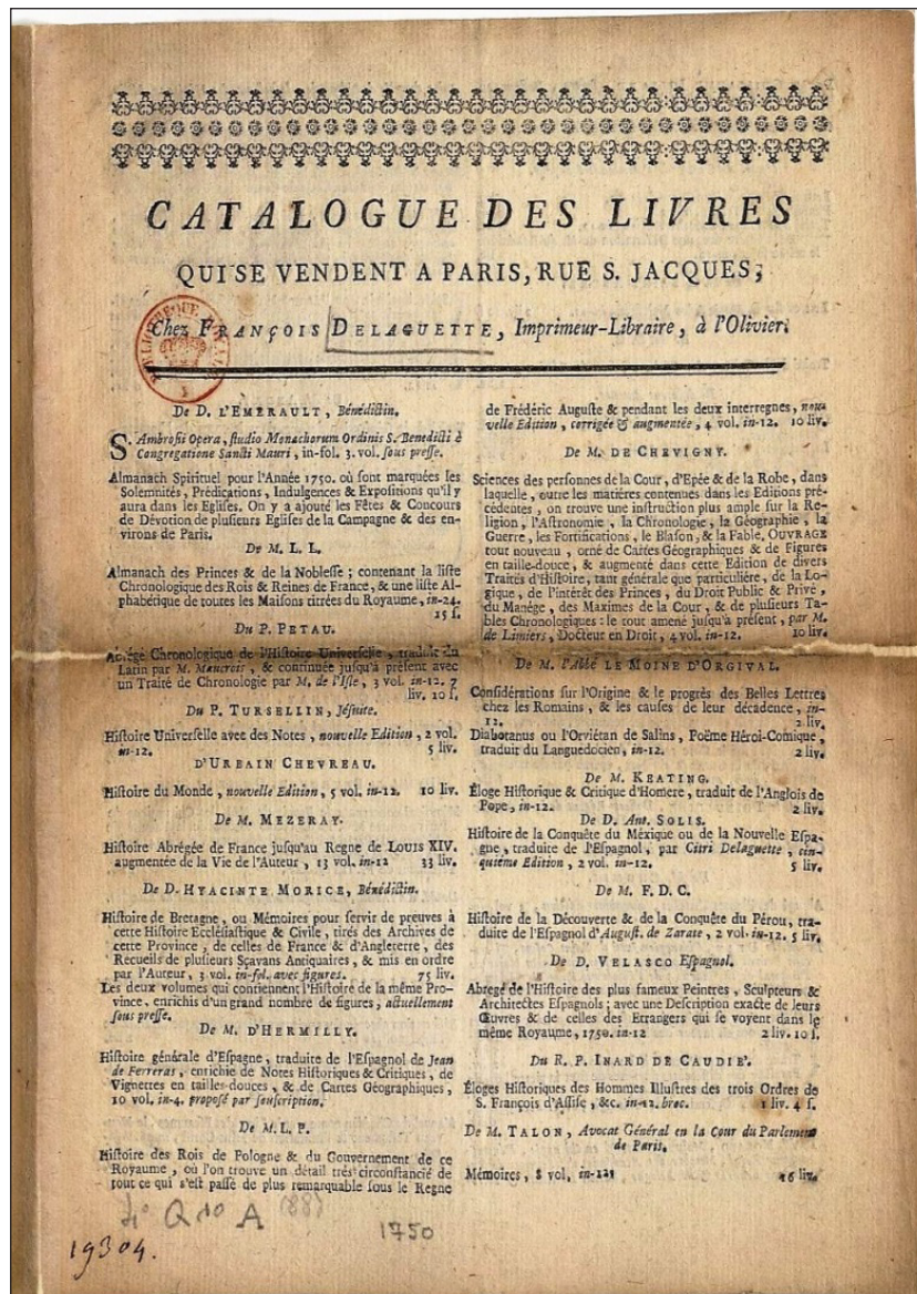
Figura 1: Imagen del Catálogo de François Delaguette (1750) conteniendo diferentes libros españoles

Y es que el libro de Mateo Alemán, punto de partida de la novela moderna, cautivó al público francés por su carácter subversivo, que criticaba todo lo imaginable.