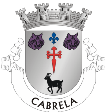
Fig. 2 - Heráldica de Cabrela, com o símbolo da espada de Santiago (a vermelho), alusivo à dependência da vila relativamente à Ordem de Santiago.

Aquando da extinção das Ordens Militares, ocorrida em 1834, a Ordem de Santiago detinha ainda um conjunto vasto de propriedades e rendas na vila de Cabrela e seu termo (Fortuna, 1997).