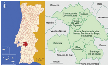
Fig. 1 - Localização da vila de Cabrela no território português.