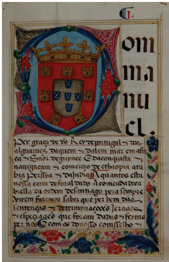
Fig.5 - Folha de rosto do foral manuelino de Cabrela. (Foral de Cabrela/Ordem de Santiago e Convento de Palmela, Liv. 72, PT/TT/OSCP/A/002/00072)

O foral de Cabrela não é assim exceção. Na sua folha de rosto apresenta a maiúscula inicial “D” (de “Dom Manuel”) ricamente iluminada com o escudo português coroado. (Fig.5) ao longo do documento, cada maiúscula iniciante de um novo item é igualmente iluminada, mas obviamente em tamanho muito inferior à maiúscula inicial do fólio de rosto. (Fig.6)