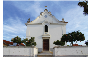
Fig.3 - Igreja Matriz da Vila de Cabrela, de invocação a Nossa Senhora da Conceição.

El Rei Dom Affonso Henrriques lhe deo foral, El Rei Dom Manoel a fez Villa a hu de Fevereiro de mil, e quinhentos, e dezacete. O seu termo tem duas Legoas de Largo, que se terminão pela estrada das Vendas novas, e pela Ribeira de Sam Martinho termo de Alcacer do Sal e quatro de comprido, que se terminão com a herdade da hengina, e das Ferrarias, que esta junto a Aldea da landeira aonde está huma Parrochia de Nossa Senhora da Nazareth filial da Matris desta Villa com cappelam curado da Ordem de