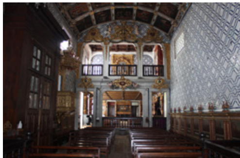
Fig. 1. Igreja do Mosteiro de Sant'Ana, Viana do Castelo

Na transformação visual do espaço sacro foram determinantes a azulejaria, a pintura, a retabulística e os embrechados pétreos. Mais rara