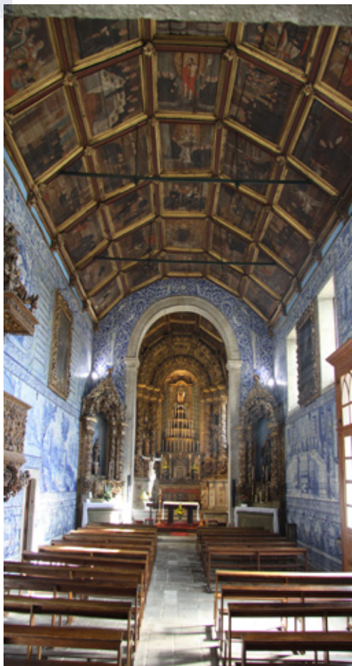
Fig. 9. Igreja do Mosteiro de N.ª Sr.ª da Conceição (nave única), Barcelos, 1707-1713

Antecedendo Trento iniciou-se no ano de 1543 a construção do Mosteiro dominicano de S. Gonçalo de Amarante (fig. 10).