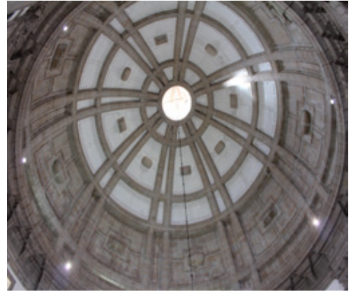
Fig. 12. Cúpula da igreja do Mosteiro da Serra do Pilar

Borromeo sugere que na fachada principal do templo figure a representação do santo patrono da igreja e dos santos de veneração local, sob a forma de pintura ou de escultura. De acor-