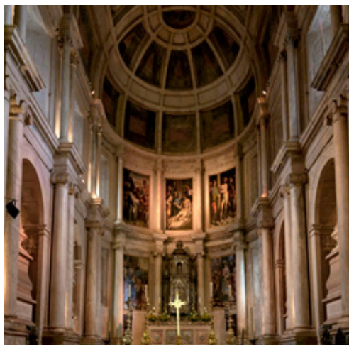
Fig. 7. Capela-mor do Mosteiro dos Jerónimos, Lisboa

Em pouco mais de meio século assiste-se à substituição da linguagem arquitetónica do principal espaço litúrgico da igreja. A arquitetura da