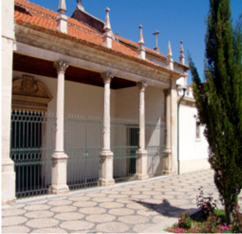
Fig. 17. Portal de acesso à igreja do Mosteiro de Jesus, Aveiro

a princesa Joana desempenhou no percurso fundacional da casa das religiosas dominicanas em Aveiro e por ter escolhido o mosteiro como última morada terrena para deposição dos seus restos mortais. A beatificação da Princesa Joana no ano de 1693 pelo Papa Inocêncio XII ajuda a explicar a excelência da retórica das linguagens visuais que permanecem no Mosteiro de Jesus de Aveiro.