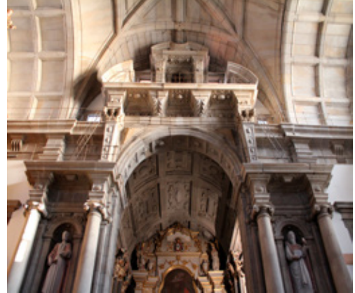
Fig. 16. Arco cruzeiro da Igreja do Colégio de São Lourenço, Porto

A história do monacato feminino em Portugal cruza-se diretamente com a estratégia política definida pelo poder central durante os primeiros séculos da Monarquia. Por questões sociais, assistenciais e de fé, os mosteiros femininos foram locais privilegiados onde realizaram votos monásticos mulheres provenientes de famílias nobres. Foram também locais eleitos onde se recolheram rainhas e princesas. No início do século XIII, a vida