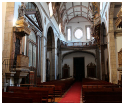
Fig. 10. Igreja do Mosteiro de São Gonçalo de Amarante

O espaço longitudinal, com capela-mor, transepto inscrito e nave com capelas laterais, é o modelo mais recorrente da arquitetura sacra portuguesa dos séculos XVII e XVIII. A nave única com capelas laterais intercomunicantes foi fundamental para a criação do modelo de nave única com capelas laterais pouco profundas que caracteriza o modelo mais seguido na arquitetura sacra portuguesa nos séculos de seiscentos e setecentos, apurado no Tempo Longo.