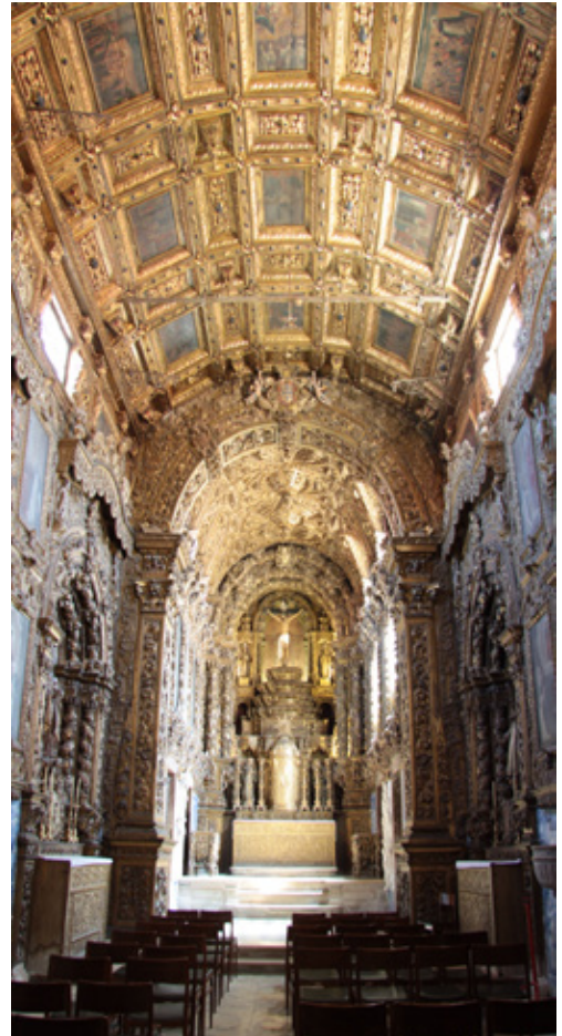
Fig. 18. Igreja do Mosteiro de Jesus, Aveiro