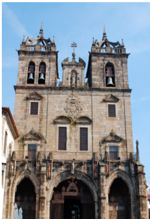
Fig. 5. Fachada da Sé de Braga

A transformação e renovação da arquitetura do espaço sacro da catedral de Braga teve início no século XVI com a construção da capela-mor pelo mestre João de Castilho, cujo projecto arquitetónico articula o programa medieval com a nova capela-mor. O plano reformador continuou em finais do século seguinte com o risco da nova sacristia por João Antunes, e culminou em 1723