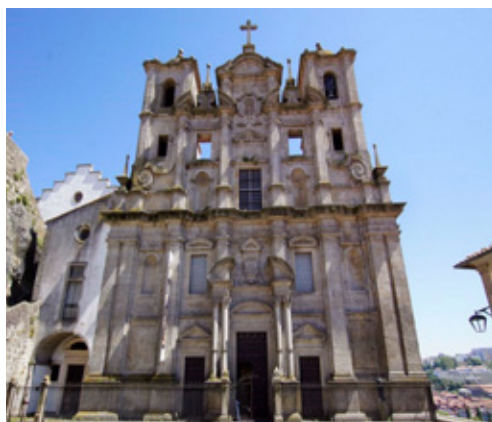
Fig. 15. Portais principais da igreja do Colégio jesuíta de S. Lourenço, Porto

imagen; las del frente mostrarán delante de si una vista tanto más agradable y augusta, cuanto más adornadas estén con imagines o pinturas sacras que describan la historia sacra.