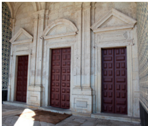
Fig. 14. Portais principais da igreja do Mosteiro de S. Salvador de Grijó

No obstante, en las paredes por la parte de afuera téngase esta norma: que en las que están por un lado y por la parte de atrás, no se represente ninguna