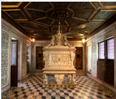
Fig. 19. Coro-baixo do Mosteiro de Jesus, Aveiro