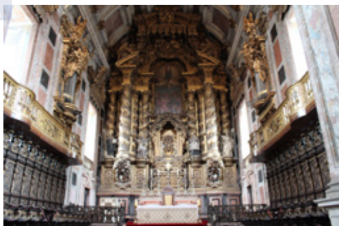
Fig. 4. Capela-mor da Sé do Porto