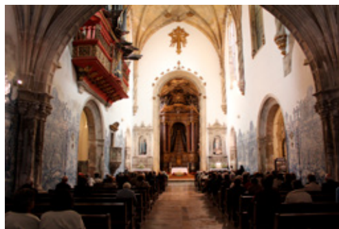
Fig. 6. Igreja do Mosteiro de Santa Cruz de Coimbra

3) Ciclo tridentino. Na sequência das orientações do Concílio de Trento os Cónegos