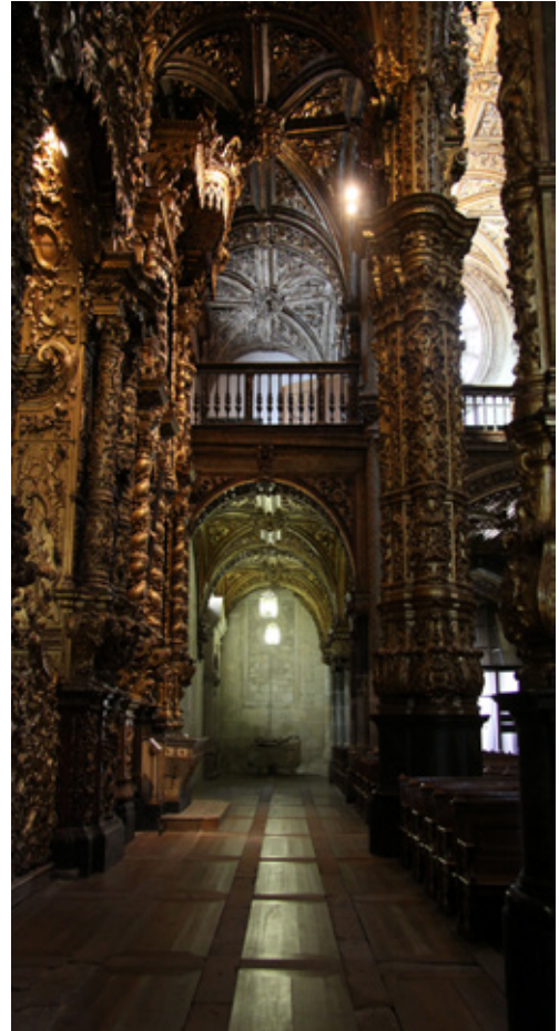
Fig. 8. Pormenor de uma das três naves da igreja do Convento de S. Francisco, Porto

3) Igrejas centralizadas. Dentre as múltiplas espacialidades centralizadas construídas em Portugal no século XVI e pela envergadura do edificado destacamos a igreja circular do Mostei-