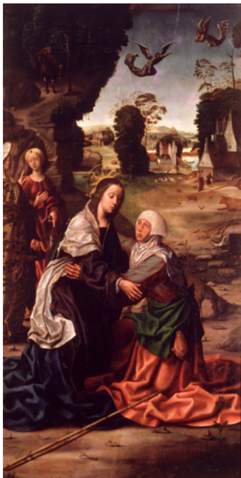
Fig. 3. Vasco Fernandes, Visitação, painel que pertenceu ao primitivo retábulo-mor da Sé de Lamego, atualmente no Museu de Lamego, 1506-1511