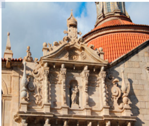
Fig. 13. Pormenor da fachada da igreja do Mosteiro de S. Gonçalo de Amarante

tológicas e marianas possam não estar presentes nas fachadas de todos os templos a promoção cultural dessas figuras explica a constituição de irmandades de leigos que se associaram para o desenvolvimento dessa orientação tridentina. Para além dos muitos espaços sacros que foram construídos para afirmação cultural do papel de Cristo e da Virgem Maria foram construídos muitos outros espaços sacros cujo orago é um Santo da Igreja Católica. No interior dos espaços sacros portugueses, fosse qual fosse a invocação tutelar do orago, o culto cristológico e mariano originou a construção de capelas, de altares e de retábulos como proposta do associativismo laical contrarreformista. Na igreja jesuítica de S. Lourenço, na cidade do Porto, permanece num dos lados do transepto o retábulo de Nossa Senhora da Purificação, como sede da Irmandade de leigos. O programa foi ideado pelo artista António Vital Rifarto e executado pelos entalhadores Francisco Correia e António Pereira em 1729-1730. Para além da arquitetura o retábulo-relicário de Nossa Senhora da Purificação é das poucas peças que esclarece as práticas litúrgicas do tempo em que a igreja desempenhou a função para a qual foi projetada: igreja do Colégio dos jesuítas no Porto.