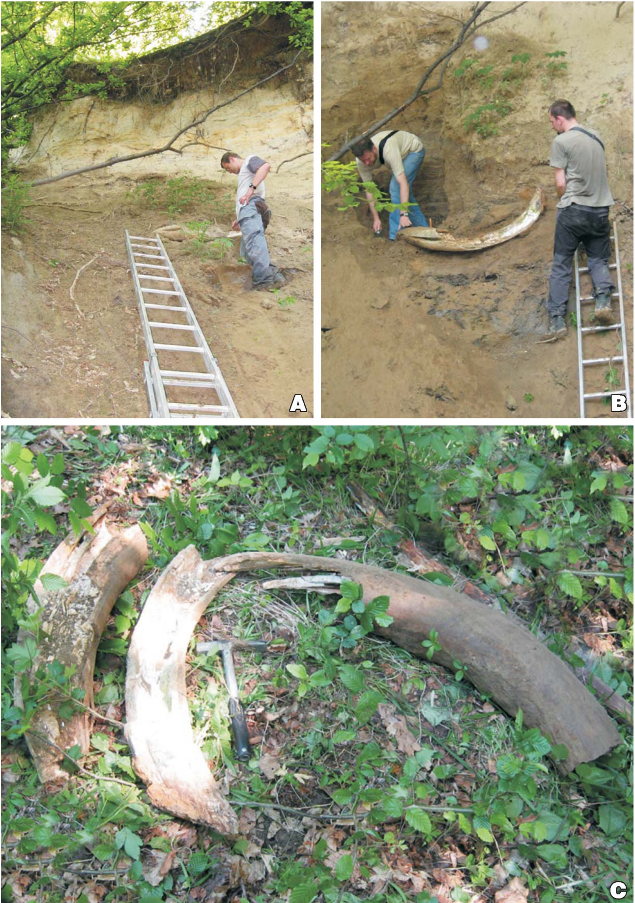
Ryc. 2. A — Profil osadów w Janowicach, B — pozycja ciosu mamuta w pokrywie soliflukcyjnej, C — cios mamuta po eksploatacji