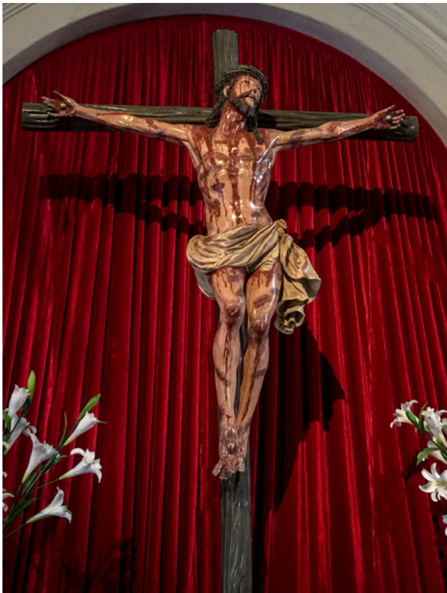
Figura 3. Martín Alonso de Mesa, Crucificado de la Sangre , después de la restauración, 1619, iglesia de Santo Domingo, Lima.