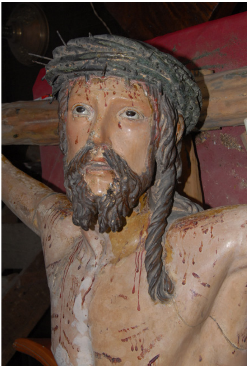
Figura 4. Martín Alonso de Mesa, Crucificado de la Sangre , detalle del rostro en proceso de limpieza, 1619, iglesia de Santo Domingo, Lima.