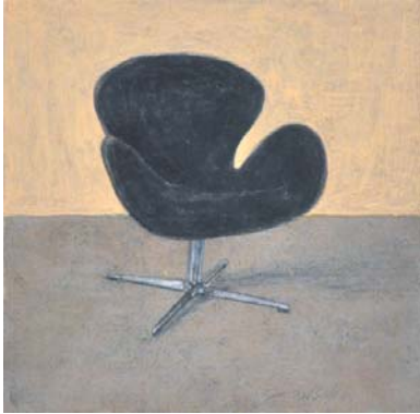
Swan. Jacobsen 2013 Óleo sobre tabla 13'8 x 13'8 cm.