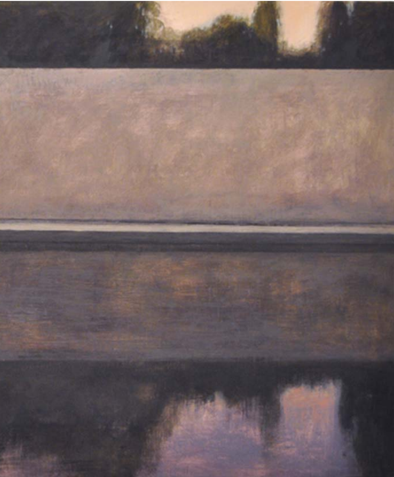
Barcelona Pavilion II. Mies Van der Rohe. 2013 Óleo sobre lienzo 120 x 200 cm.