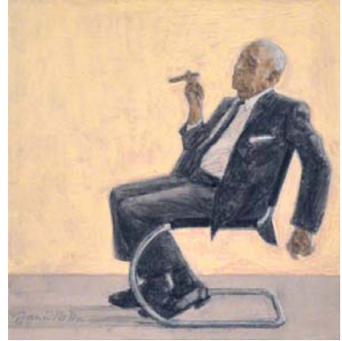
Mies Van der Rohe. 2013 Óleo sobre tabla 13'8 x 13'8 cm.