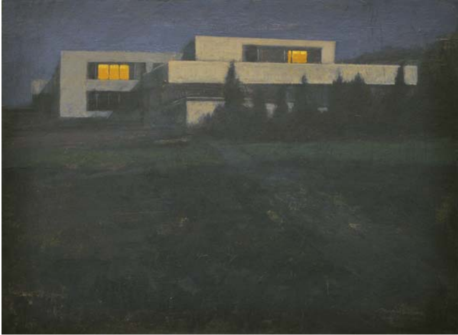
Villa Tugendhat – Nocturno. Mies Van der Rohe. 2013 Óleo sobre tabla 45 x 60 cm.