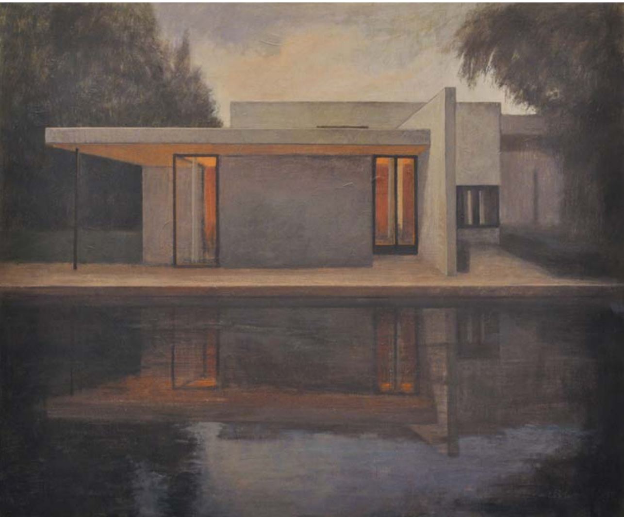
Casa Fray León II. Estudio 57- Chile. 2013 Óleo sobre tabla 100 x 120 cm.