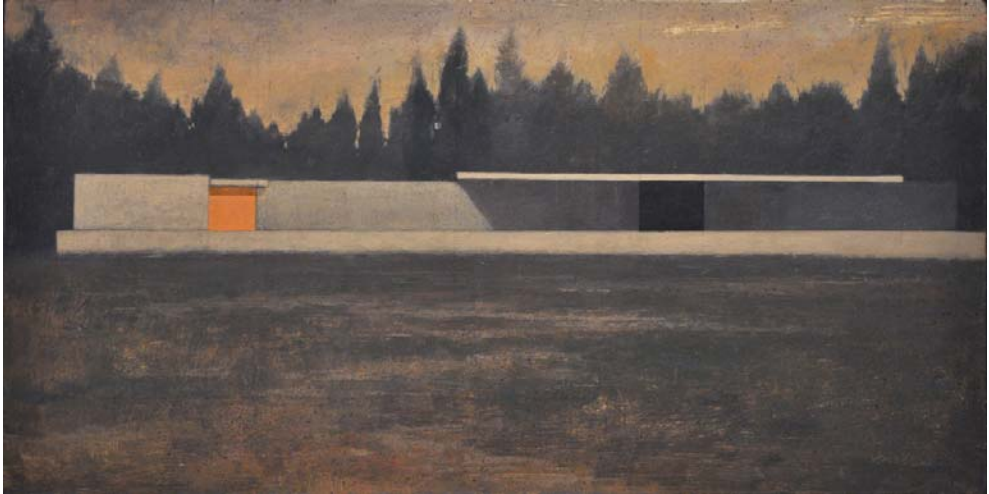
Barcelona Pavilion VI. Ext. Mies Van der Rohe. 2013 Óleo sobre tabla 40 x 79 cm.