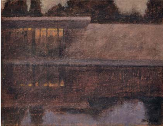
Barcelona Pavilion I. Mies Van der Rohe. 2013 Óleo sobre lienzo 19 x 24 cm.