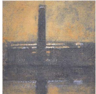
Tate Modern. 2013 Óleo sobre tabla 13'8 x 13'8 cm.