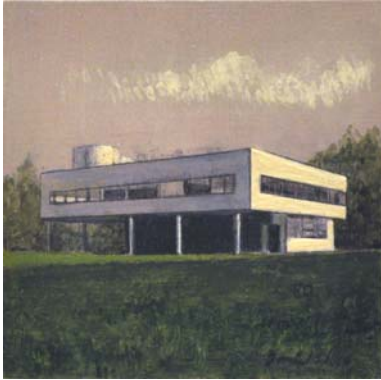
Villa Savoye. Le Corbusier. 2013 Óleo sobre tabla 13'8 x 13'8 cm.