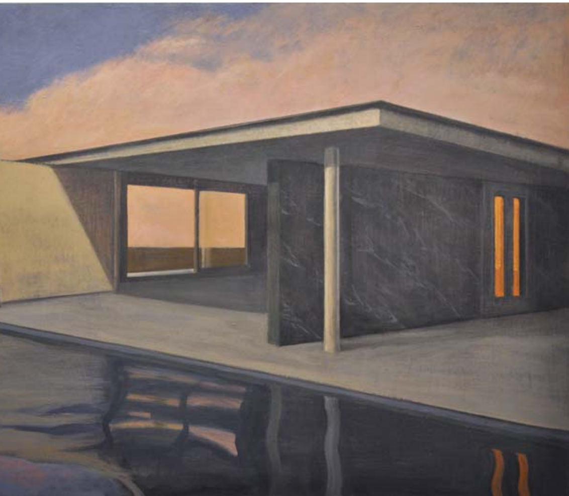
Barcelona Pavilion IV. Mies Van der Rohe. 2013 Óleo sobre tabla 100 x 150 cm.