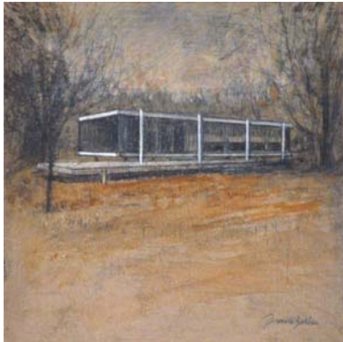
Farnsworth house-Autumn. Mies Van der Rohe. 2013 Óleo sobre tabla 13'8 x 13'8 cm.