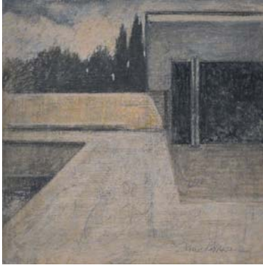
Barcelona Pavilion V. 2013 Óleo sobre tabla 13'8 x 13'8 cm.