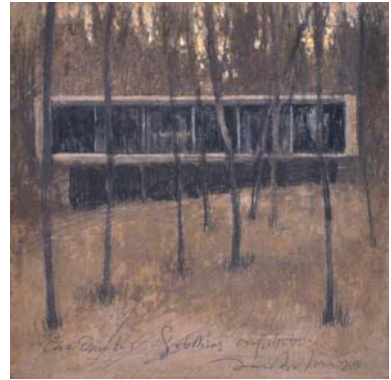
Casa Ómnibus. Gubbins. 2013 Óleo sobre tabla 13'8 x 13'8 cm.