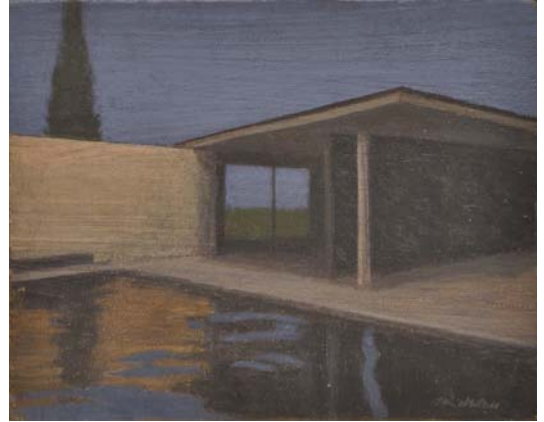
Barcelona Pavilion III. Mies Van der Rohe. 2013 Óleo sobre lienzo 19 x 24 cm.