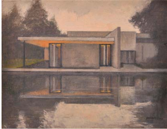
Casa Fray León I. 2013 Óleo sobre lienzo 21 x 27 cm.