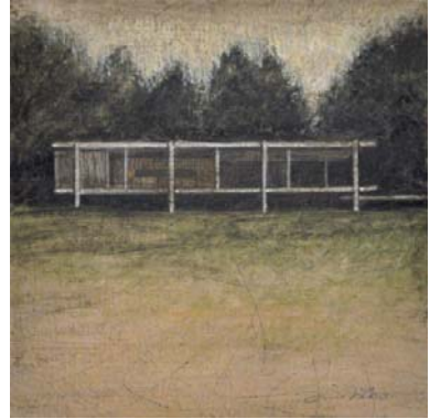
Farnsworth house - Spring. Mies Van der Rohe. 2013 Óleo sobre tabla 13'8 x 13'8 cm.