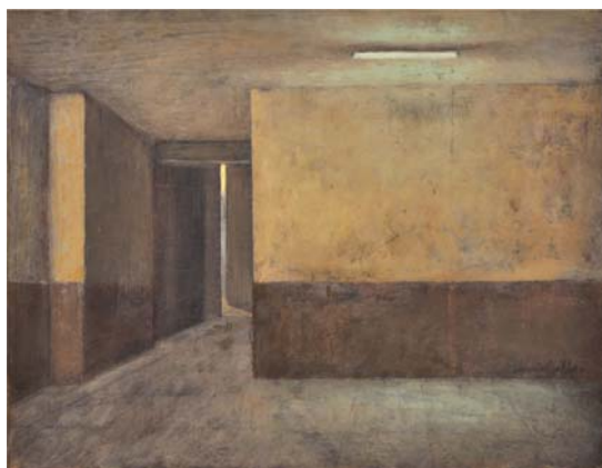
Interior I. 2013 Óleo sobre papel 21 x 27 cm.