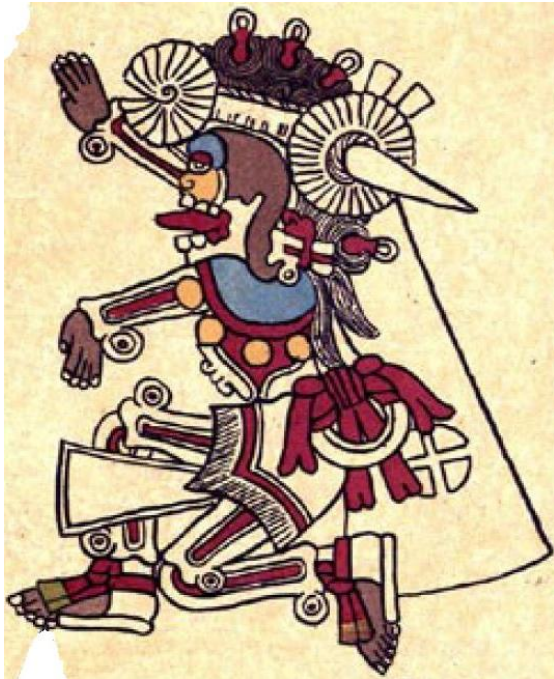
Fig. 1 El dios Mictlantecuhlti . Códice Borbónico [en línea] lám. 10 (detalle). Fundación para el Avance de los Estudios Mesoamericanos Inc. http://www.famsi.org/spanish/research/loubat/Borbonicus/thumbs0.html [Consulta 10 mayo 2018]