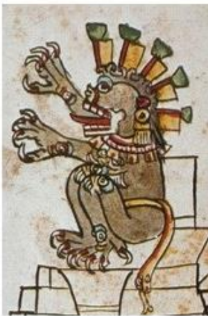
Fig. 3 Mictlantecuhtli (detalle). Ferdinand Anders y Martin Jansen (eds.), Códice Magliabechiano . México: Akademische Druck- und Verlagsanstalt, Fondo de Cultura Económica, 1996, fol 159.

las banderas al proponer una interpretación para el cabello hirsuto. En cuanto a los ojos del cabello, nuevamente puede tratarse de elementos estelares, especialmente porque el cabello es análogo al nivel celeste del dios, pero en realidad todo el cuerpo puede portar elementos semejantes; particularmente, orejas, las pulseras, sandalias, telas y otras prendas. En ocasiones parece tratarse claramente de ojos humanos, mientras que otras veces se acentúa su naturaleza estelar. En parte esto se explica por el equiparamiento que pueden plantearse entre la noche y el inframundo. 9 Pero además Mictlantecuhtli es una deidad sacrificadora, manos y ojos humanos cercenados se vinculan con este aspecto del dios.