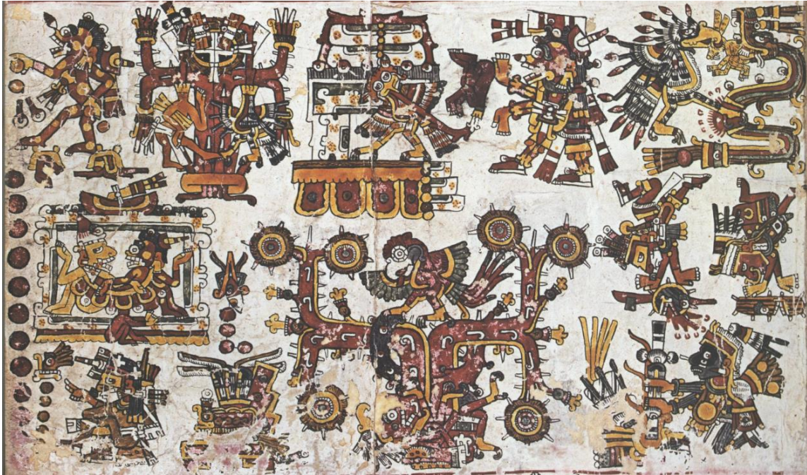
Fig. 10. El rumbo cósmico del sur en el Códice Borgia (Ibídem: fol. 52)

contienen la personalidad y la animación, la materia ligera, de las deidades de la muerte, incluso portan sus atavíos (fig. 10).