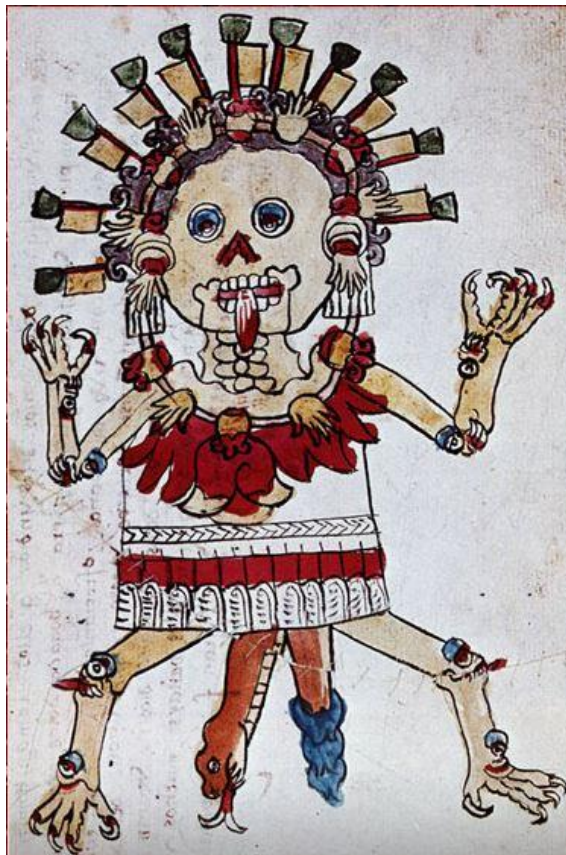
Fig. 6. Una Tzitzimil según el Códice Magliabechiano . Anders y Jansen (eds.), Códice Magliabechiano , op. cit., fol. 76r.

Otras deidades vinculadas a la muerte también despliegan este rasgo; las Tzitzimime de los códices Magliabechiano y Tudela 25 (fig. 6), por ejemplo; incluso los trajes guerreros de Tzitzímitl lo exhiben con gran claridad, pues en estos casos el tamaño relativo de la vesícula respecto a los lóbulos hepáticos es algo más realista y puede tomar otro color.