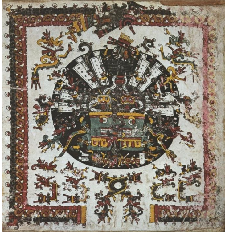
Fig 7. Una impresionante escena del inframundo. Anders, Jansen y Reyes (eds.), Códice Borgia , fol. 29