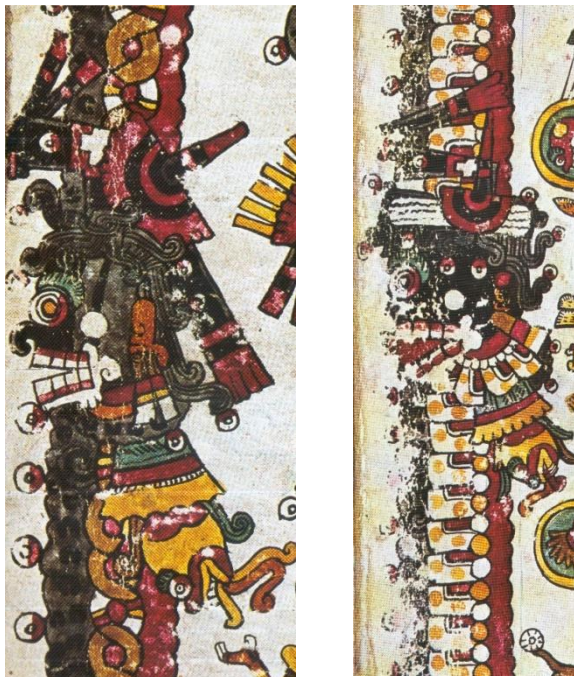
Fig. 8. A la izquierda, la entidad que forma con su cuerpo el espacio nframundano en la fig. 7. Ibídem , fols. 29 y 30 (detalle)

En tanto nivel cósmico, más allá de si éste se encuentra perfectamente localizado y determinado hasta el fondo de los inframundos, o si su naturaleza es más difusa y penetra o no en otros estratos, debe tener entradas y salidas, como las tienen otros dioses. La tierra en general, por ejemplo, tiene umbrales que penetran hacia su interior.