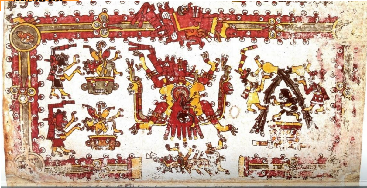
Fig. 11. Otra escena al interior de una deidad de la muerte en que intervienen deidades menores de la muerte. Nótese las vísceras eventradas en varias de ellas. Códice Borgia , Ibídem : fol. 31.