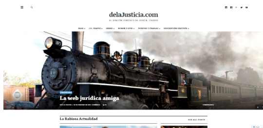
Figura 1. Página web de delaJusticia.com (Blawgs_1)