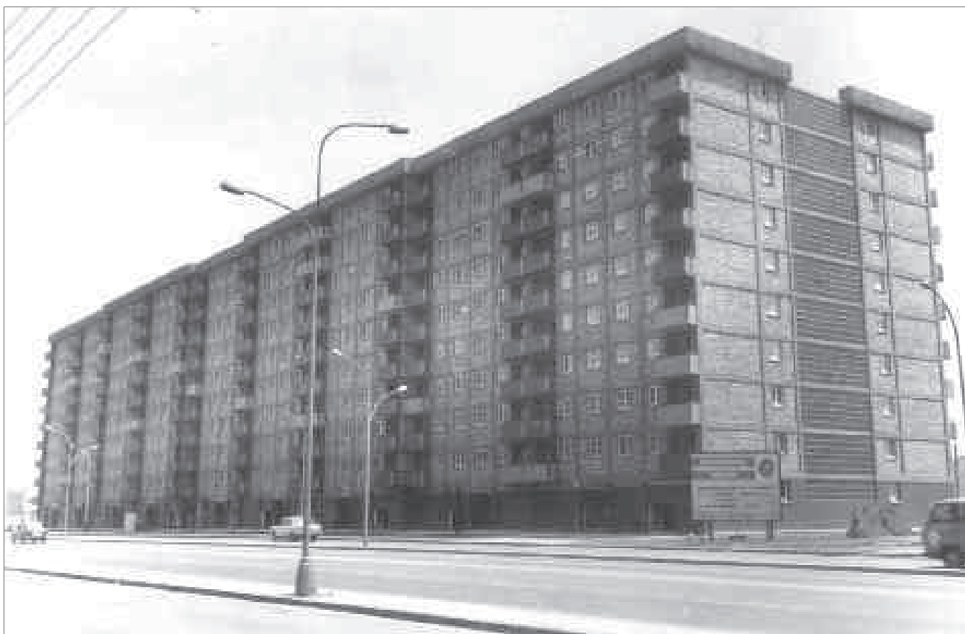
Grup d'habitatges Sant Jaume, 1972. Museu de Badalona. Arxiu d'imatges. Fotògraf: Genís Vera.

Des del punt de vista físic, alguns d'aquests habitatges, tenen avui importants patologies (aluminosi, carbonatosi, etc.) que recomanen la seva substitució, com és el cas de Sant Roc, al voltant de la plaça del