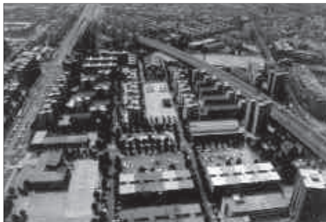
Vista general dels barris de Sant Roc i del Congrés [199?].

Sant Roc (1964). Amb 3.395 habitatges, és el polígon d'habitatge social quantitativament més important. El promotor és l'Obra Sindical del Hogar i està inclòs en el Pla d'Urgència Social de l'any 1958. Està situat a la part sud de la ciutat sobre un terreny pla, pròxim a les àrees industrials, que penja de la carretera N-II i està