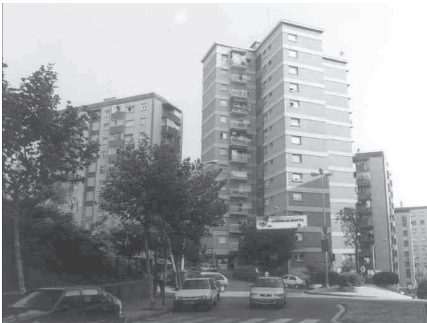
Un aspecte dels habitatges de promoció pública de Sant Antoni de Llefià, 1999. Museu de Badalona. Arxiu d'imatges. Fotògraf: Albert Cartagena.