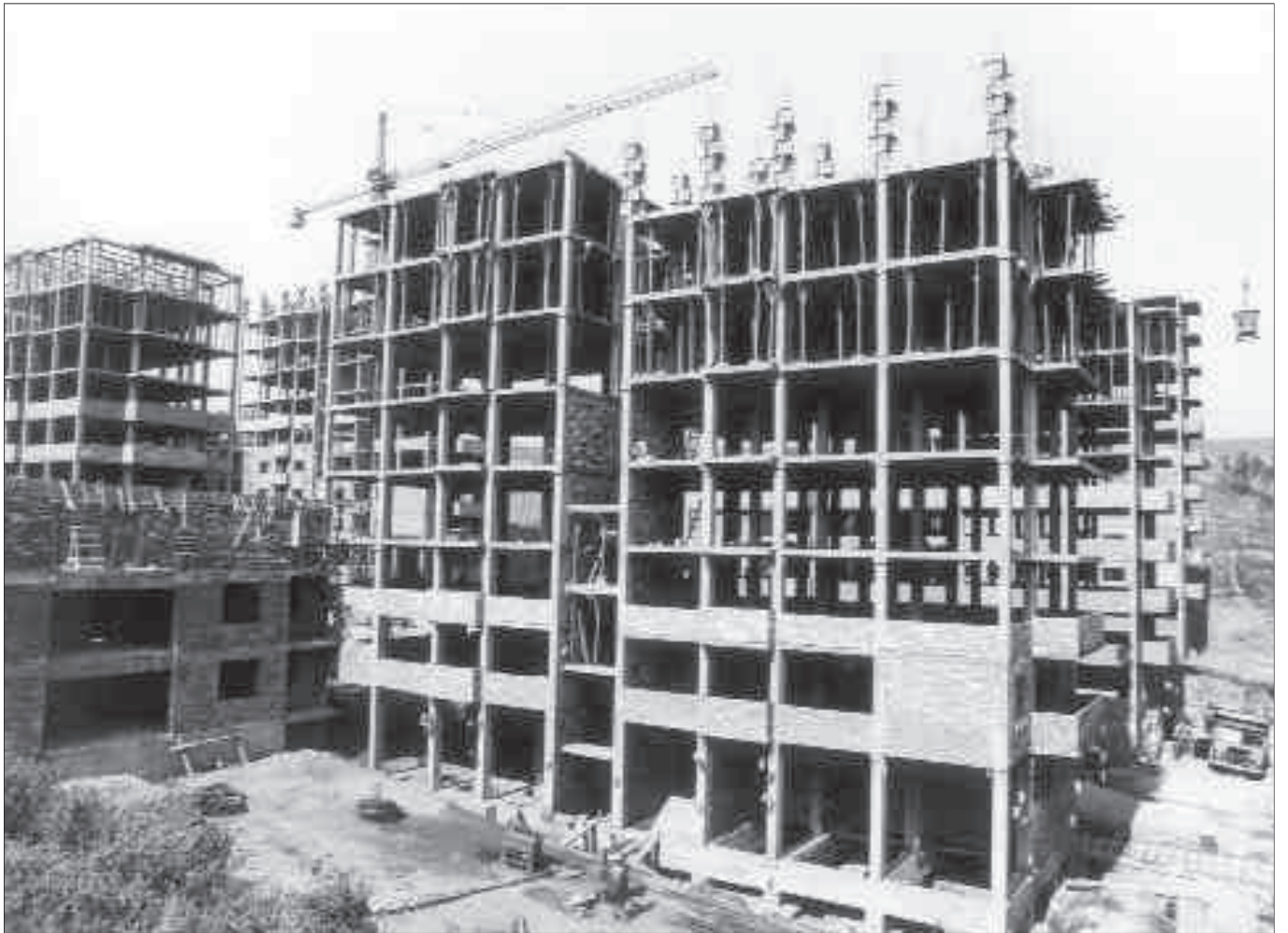
Habitatges en construcció del grup Verge de la Salut [1968].