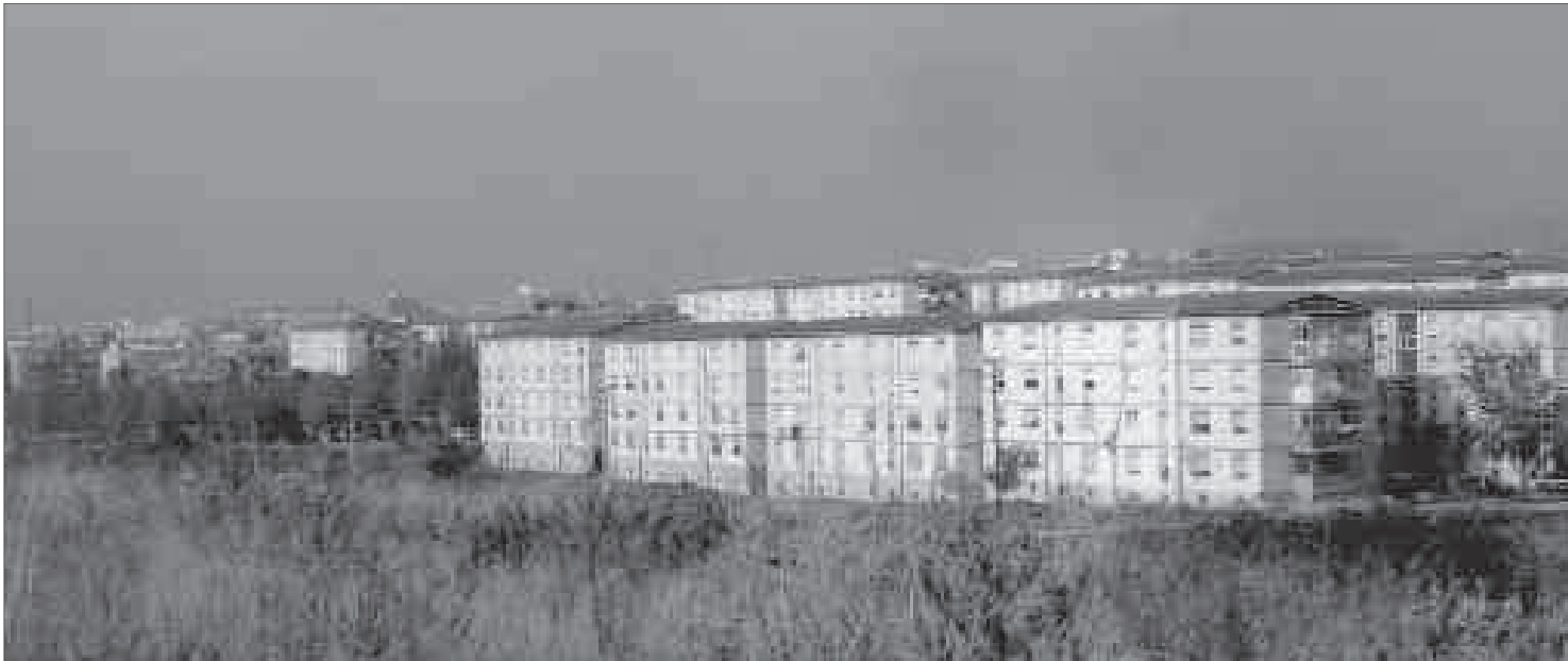
Vista general del polígon d'habitatges de Pomar, 1999.

dicionen els processos de possible o necessària transformació, així com el paper dels agents que hi intervenen. Així, les formes de construcció fragmentàries, dilatades en el temps, amb unitats petites... ofereixen més possibilitat de substitució, i més dificultat per modificar, en canvi, el model estructural d'organització. Conjunts més unitaris, al contrari, permeten i obliguen a plantejar processos de transformació més globals, en els quals, sovint, aquesta transformació és equivalent a la producció de ciutat nova.