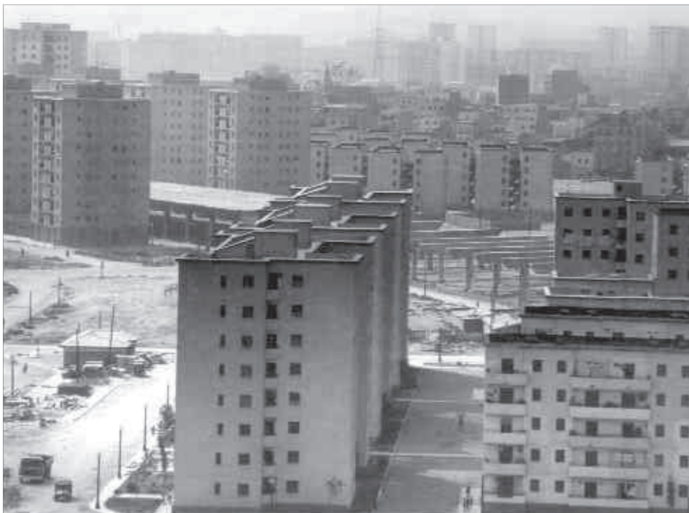
Un aspecte del barri de Sant Roc amb l'autopista en construcció, 1969.