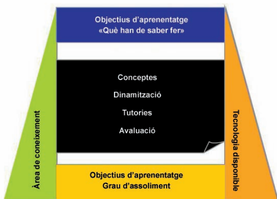
Figura 1. Què cal tenir en compte en la planificació d'una activitat d'aprenentatge.

3) Tot i que el treball ha de ser individual, els alumnes han d'interaccionar freqüentment per resoldre problemes, per explicar determinats conceptes als seus companys, per assegurar-se que els han entès, per connectar el treball present amb el que ja havien après anteriorment, per ensenyar i animar els altres, etc. Per tant, hi desenvolupa un paper clau la interacció.