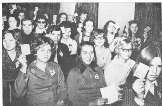
Делегаты комсомольской конференции принимают решение бороться за присвоение УЛТИ имени Ленинского комсомолу

29 октября текущего года исполнилось 100 лет Ленинского комсомолу. Наш вуз – Уральский государственный лесотехнический университет (УГЛТУ) – носит имя Ленинского комсомолу, присвоенное в 1978 году тогдашнему Уральскому лесотехническому институту (УЛТИ) накануне его 50-летия (1980 г.) за успехи в подготовке высококвалифицированных специалистов и развитие научных исследований, за заслуги в воспитательной деятельности, в организации труда, быта и отдыха студентов. Знает ли нынешняя молодёжь, обучающаяся в УГЛТУ, что собой представлял комсомол? Насколько значим был статус комсомолу, если его имя было столь престижно, что им удостаивались организации и коллективы в знак особых заслуг перед нашей страной?