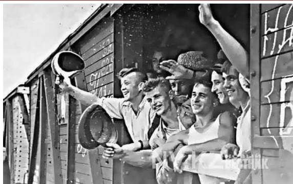
Поездка на целину начиналась, как приключение. Но не многие потом выдерживали.

( https://www.chel.kp.ru/daily/26793.7/3827232/ ).