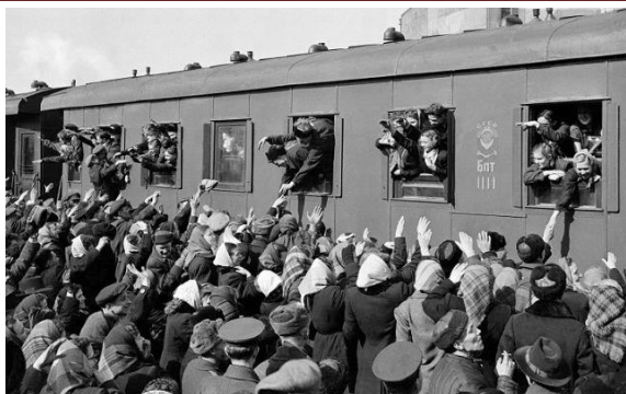
1955 год. Проводы на целину...