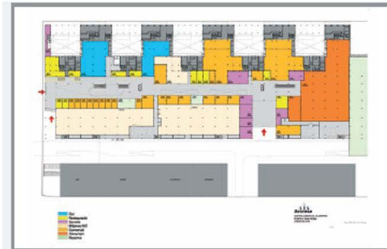
Fig. 1. Planta baja.