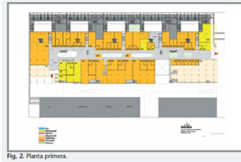
Fig. 2. Planta primera.