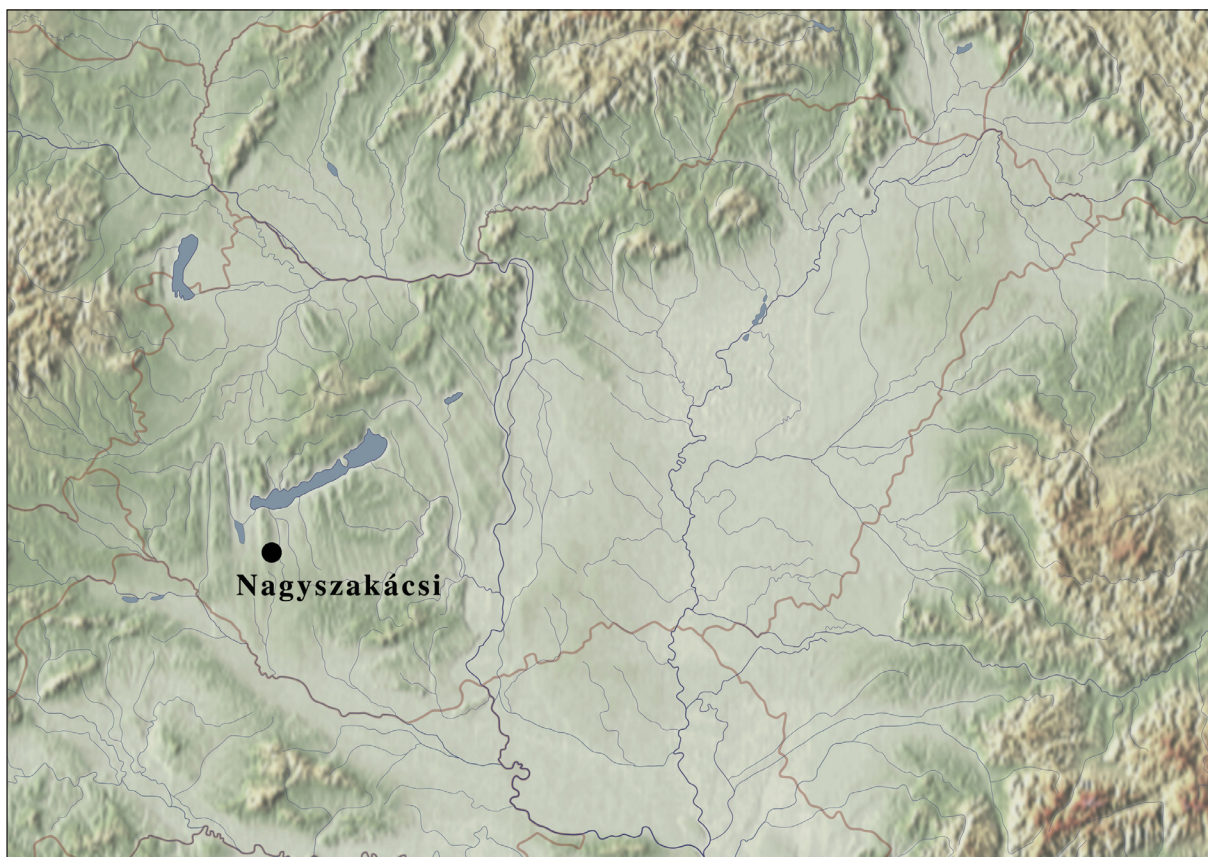
1. ábra: Nagyszakácsi Magyarország térképén. (Készítette Zatykó Csilla)

Nagyszakácsi, a középkorban Szakácsi, Nagyszakácsi, Külsőszakácsi, Felsőszakácsi, illetve Kisszakácsi néven említett település(ek) a Dunántúli-dombvidék, Belső-Somogy, azon belül is a Marcali-hát kistájegység területén található(ak). A mai település Marcalitól délnyugatra mintegy 20 km-re fekszik. (1. ábra) A Marcali-hát általában alig emelkedik kétszáz méter fölé, területén az egykori cseres-tölgyes erdő ma már csak mozaikos foltokban mutatkozik, jellemzően ligetes tájakat találunk. Nagyszakácsi és környéke a Balaton vízgyűjtő területéhez tartozik, a falut az észak-déli folyású Nagyszakácsi-patak szeli át. Határának jelentős része mezőgazdasági művelés alatt van, nagyobb, terepbejárásra alkalmatlan területeket csak az erdővel, legelővel fedett észak-nyugati részek és délen a zombékos, vizenyős területek jelentettek.