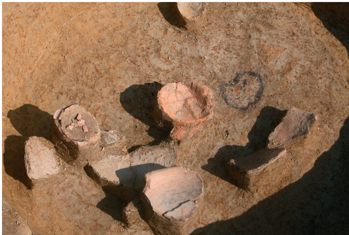
Sl. 5 Jama SJ 409.