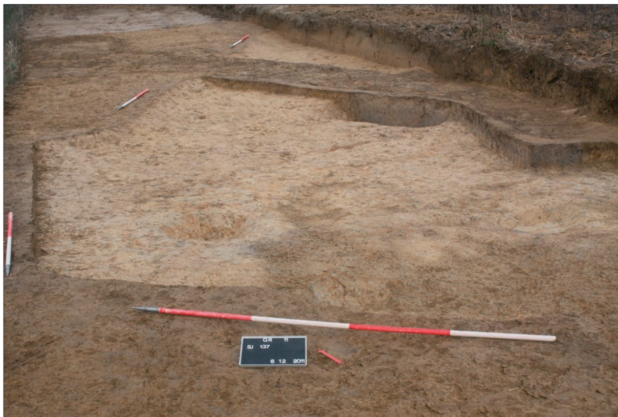
Sl. 4 Jama SJ 137.