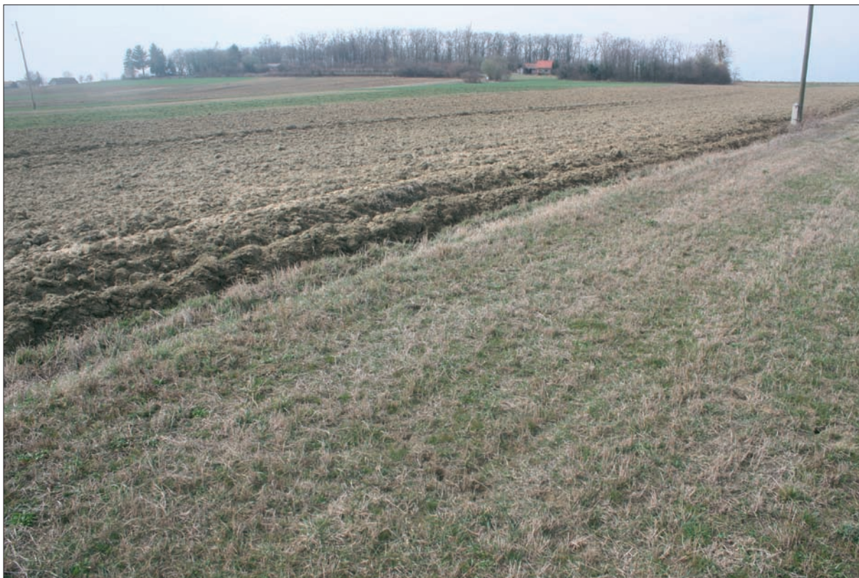
Sl. 2 Pogled na nalazište.