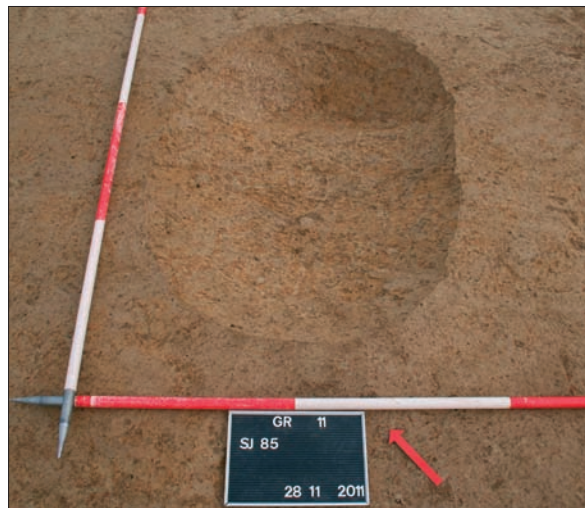
Sl. 3 Jama SJ 85.

S obzirom na prikupljene nalaze, u zaštitnim istraživanjima nalazišta AN 1 Grabrić otkriveni su ostaci naselja iz kasnoga brončanog doba te kasnoga srednjeg vijeka.