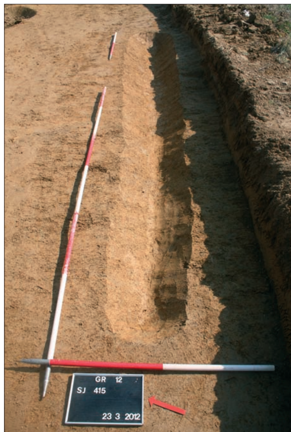
Sl. 6 Kanal SJ 415.

Manji dio pronađenih objekata, posebno na južnom dijelu trase autoceste i zapadnog prijelaza, odnosno bliže vrhu brežuljka, pripada razdoblju kasnoga srednjeg vijeka kad se na uzvišenju nalazilo naselje čija je infrastruktura uključivala kuće, jame i kanale. Vjerojatno je riječ o manjem naselju od nekoliko obitelji koje su naselile istaknuto uzvišenje iznad doline dvaju potoka čije su padine bile iznimno pogodne za poljodjelstvo. Na trasi putnog prijelaza otkriven je dio velikog i plitko ukopanog objekta s rupama za stupove uz rubove i po sredini, vjerojatno od nosača krovne konstrukcije (sl. 4). Pronađene su i jame ovalnog oblika, zatim kanali U-presjeka, od kojih su pojedini ukopani i do 1 m dubine, te ukopi rupa za stupove koje pripadaju