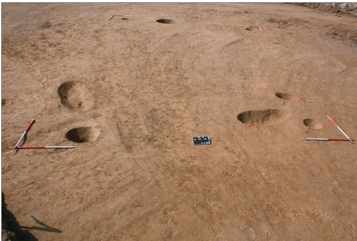
Sl. 7 Ostaci kuće na jugoistočnom dijelu nalazišta.