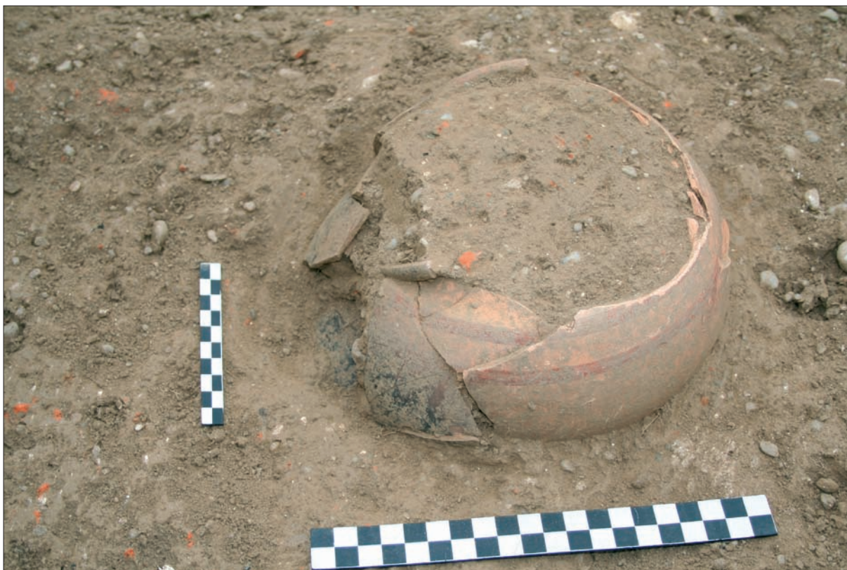
Sl. 6 Posuda PN 58.