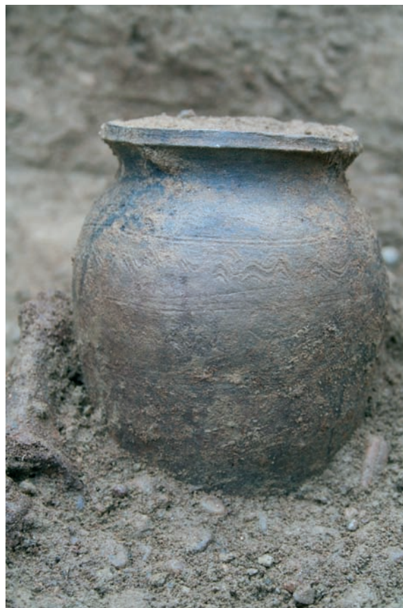
Sl. 5 Posuda iz groba 108.

Pri istraživanjima provedenima 2011. godine u kvadrantu J 10 pronađen je negativ temelja sjevernog zida nekog objekta, najvjerojatnije crkve (SJ 196), koji se pružao u smjeru sjeverozapad – jugoistok i u čijem je istočnom dijelu pronađeno in situ kamenje povezano mortom (SJ 198) – preostatak temelja. Ispred južnog profila tadašnje sonde pronađena je još jedna nakupina kamenja povezanog mortom koji se veže na SJ 198, no kako ima drugi smjer pružanja, imenovan je kao SJ 205. Struktura se nastavljala i ispod profila tadašnje sonde. Na osnovi toga nalaza odlučeno je da se u ovoj kampanji otvore i istraže kvadranti I i J 9, te da se dobije tlocrt crkve. Nakon što je skinut orani sloj i u potpunosti očišćen ostatak zida koji se nalazi u kvadrantu J 9, ustanovljeno je da je očuvan in situ u duljini od svega 50-ak centimetara (nekoliko kamena međusobno povezanih mortom). Još nekoliko kamenova sačuvano je u pravcu pružanja temelja prema jugu, no oni su se nalazili na sekundarnom položaju i međusobno nisu bili vezani mortom nego se između njih nalazila zemlja. Kao i u kvadrantu J 10, i ovdje je preostatak zida ležao na sitnom, sipkom šljunku položenom na zdravicu.