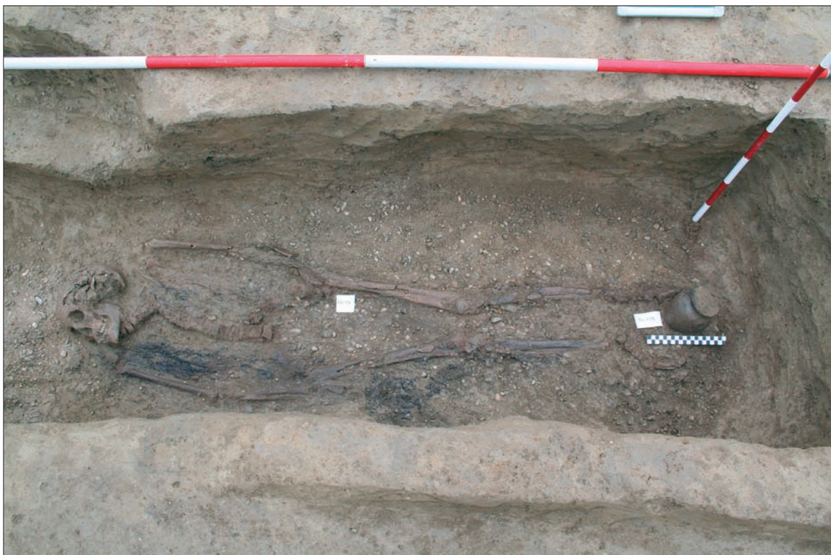
Sl. 4 Ranosrednjovjekovni grob 108.