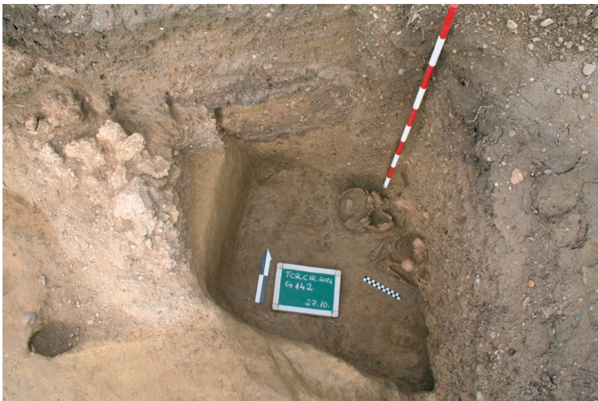
Sl. 2 Ostatak zida SJ 205 te ukop groba 142.

Fig. 2 Remains of wall SU 205 and burial of grave 142.