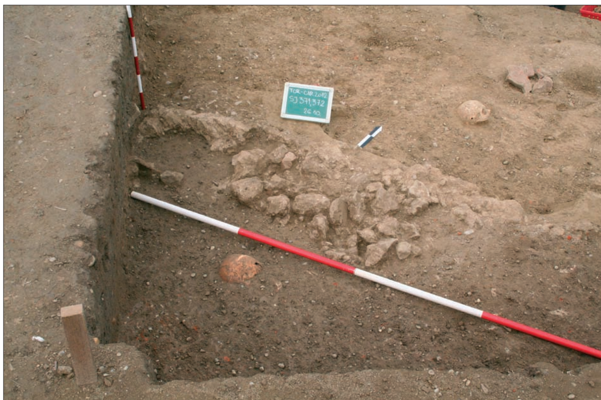
Sl. 3 Dio zida SJ 371 pronađen unutar sonde.

J 9 istražen je do zdravice, odnosno do kulturno sterilnog sloja, a kvadrant I 9 se nije stigao u potpunosti istražiti – ostalo je neistraženo nekoliko grobova te se nije u potpunosti istražila struktura zida SJ 371 u zapadnoj trećini kvadranta.