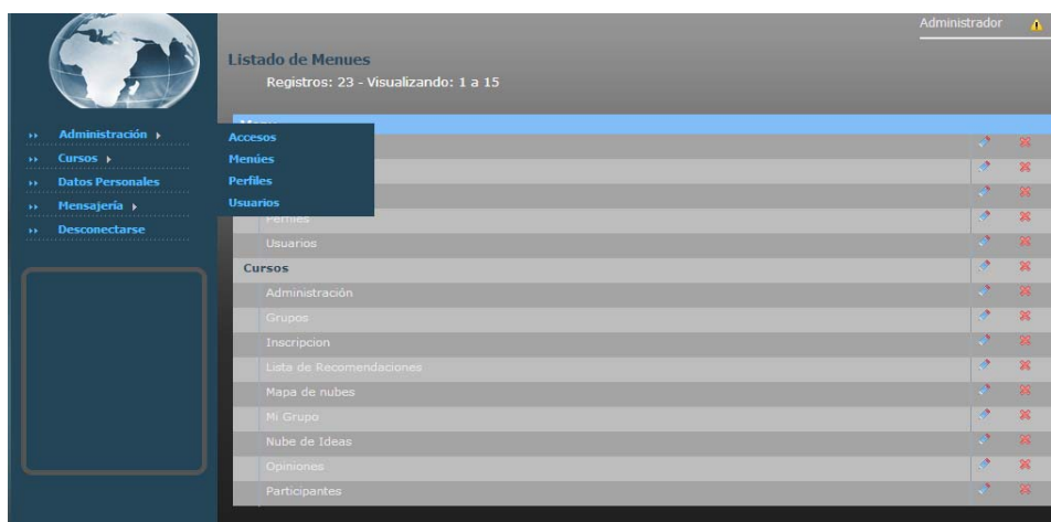
Fig1. Administración de sesiones de Metaplan