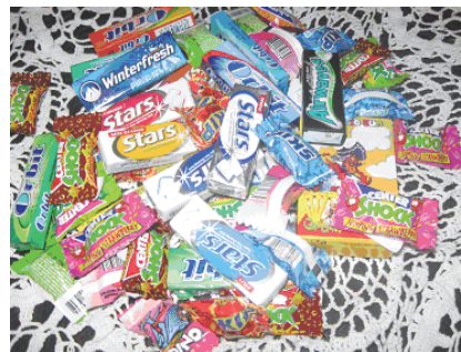
Слика 1. Жвакаће гуме.

Нико не може бити сигуран где и када је измишљена прва жвакаћа гума. Историчари тврде да су старе цивилизације жвакале природне жваке пре више хиљада година. Сматра се да су стари Грци жвакали смолу дрвета мастике, Арапи пчелињи восак, Римљани там-