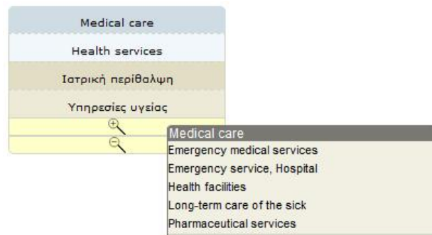
Εικόνα 2: Πλαίσιο θεματικής επικεφαλίδας “Medical care” και θεματικό μενού (context menu) στενότερων όρων

Όταν ο χρήστης επιλέξει μια θεματική επικεφαλίδα από τις προτεινόμενες, δημιουργείται ένα πλαίσιο κάτω από το πεδίο αναζήτησης αυτόματης συμπλήρωσης που περιέχει την επιλεγμένη θεματική επικεφαλίδα (βλέπε εικ. 2). Στη δίγλωσση έκδοση της υπηρεσίας, το πλαίσιο αποτελείται από την αγγλική ετικέτα της επιλεγμένης θεματικής επικεφαλίδας μαζί με την ελληνική της μετάφραση καθώς και με τους προτιμώμενους και μη προτιμώμενους όρους στα ελληνικά και στα αγγλικά αντίστοιχα.