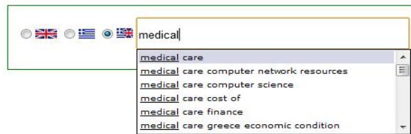
Εικόνα 1: Πεδίο αυτόματης συμπλήρωσης

Αρχικά, οι χρήστες καλούνται να εκφράσουν τις πληροφοριακές τους ανάγκες στα ελληνικά ή/ και στα αγγλικά (βλέπε εικ. 1).