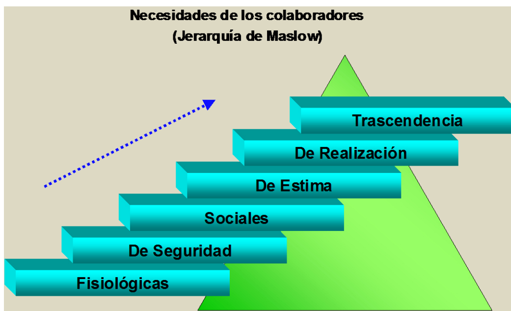
Figura 1. Pirámide de Maslow

Estas necesidades se satisfacen en el orden en que se han enumerado; de esta manera, cuando la necesidad número una ha sido satisfecha, la número dos se activa y así sucesivamente. Cuando las personas han cubierto suficientemente sus cuatro necesidades básicas, es cuando se sienten motivadas por la necesidad de crecimiento. Maslow representa gráficamente su teoría mediante una pirámide.