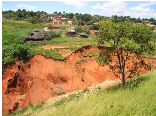
Figura 13. Residências próximas à erosão.

Além da erosão como um todo se constituir como uma área de risco, há pontos específicos que merecem atenção especial, tais como as mostradas nas Figuras 13 e 14.