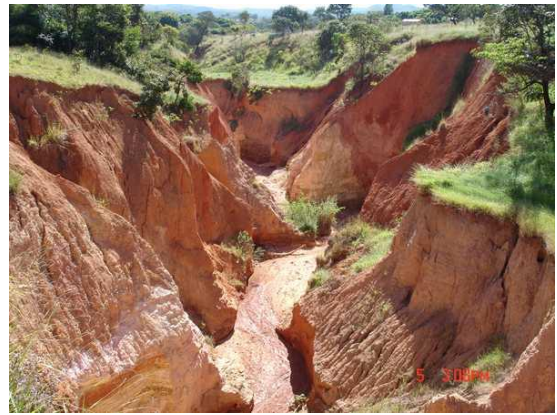
Figura 10. Processo erosivo no terceiro trecho.

Verifica-se a predominância de taludes em latossolo vermelho, latossolo amarelo e cambissolos, e a surgência de água no vale da erosão com a conseqüente saturação das bases dos taludes. A Figura 10 apresenta uma vista do processo erosivo no terceiro trecho.