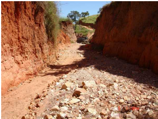
Figura 9. Processo erosivo no segundo trecho.