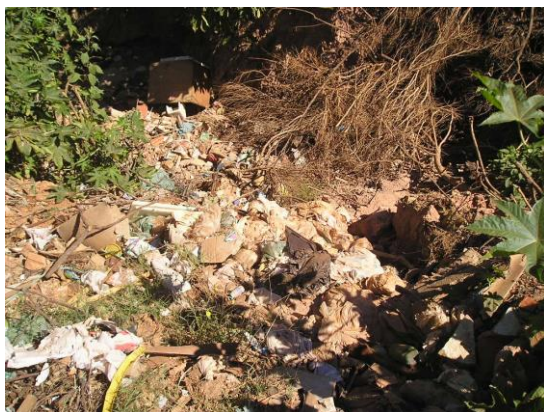
Figura 3. Área do início do processo erosivo.

As Figuras 3 a 7 mostram a área do início do processo erosivo, deságues e vistas das ramificações.