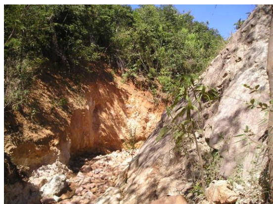
Figura 7. Vista da ramificação 2.