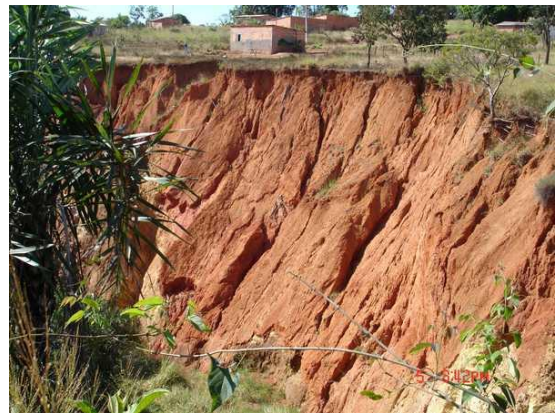
Figura 11. Processo erosivo no quarto trecho (Foto de 2007. A residência vista já foi consumida pela erosão).

Este trecho se estende, aproximadamente, a partir da distância 980m do início da erosão, e vai até a distância aproximada de 2.339,11m. Verifica-se a predominância de solo de alteração com alternância de latossolos, e a surgência de água no vale da erosão com a conseqüente saturação das bases dos taludes. As Figuras 11 e 12 mostram vistas do processo erosivo no quarto trecho.