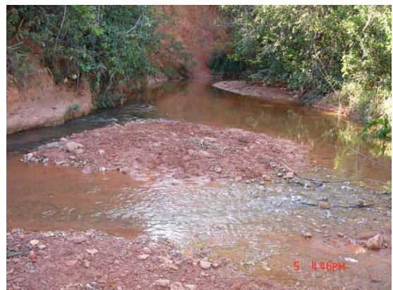
Figura 12. Córrego assoreado ao final do processo erosivo.