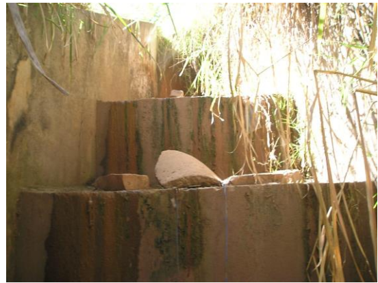
Figura 4. Deságue na ramificação 1.