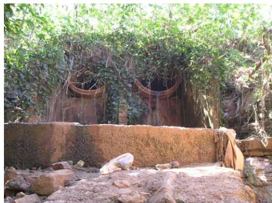
Figura 6. Deságue na ramificação 2.