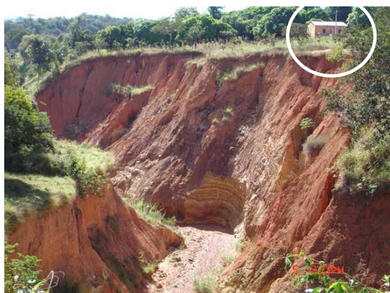
Figura 14. Residência próxima à erosão.