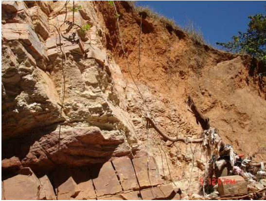
Figura 8. Processo erosivo no segundo trecho.

Estende-se 20 metros depois da junção das duas ramificações, próximo de 200 metros do início da erosão, e vai até cerca de 680m. Presença de rocha friável macia, e predominância de latossolo vermelho, latossolo amarelo e cambissolo, blocos de rochas - assentes a rocha dura na base dos taludes. Tal camada de rocha até a altura de 2 metros. Presença de taludes em rochas fraturadas. As Figuras 8 e 9 mostram vistas do processo erosivo no segundo trecho.