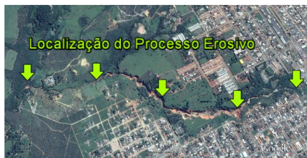
Figura 1. Localização do processo erosivo no município Planaltina/GO.

Próximo a 1.680 metros há uma erosão lateral, do lado direito com extensão aproximada de 320 metros e largura média de 5 metros. A Figura 1 apresenta a visão geral do processo erosivo.