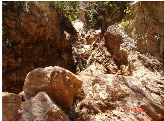
Figura 5. Vista da ramificação 1.