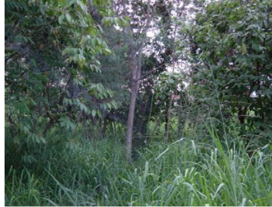
Figura 3: Pontos de coleta: