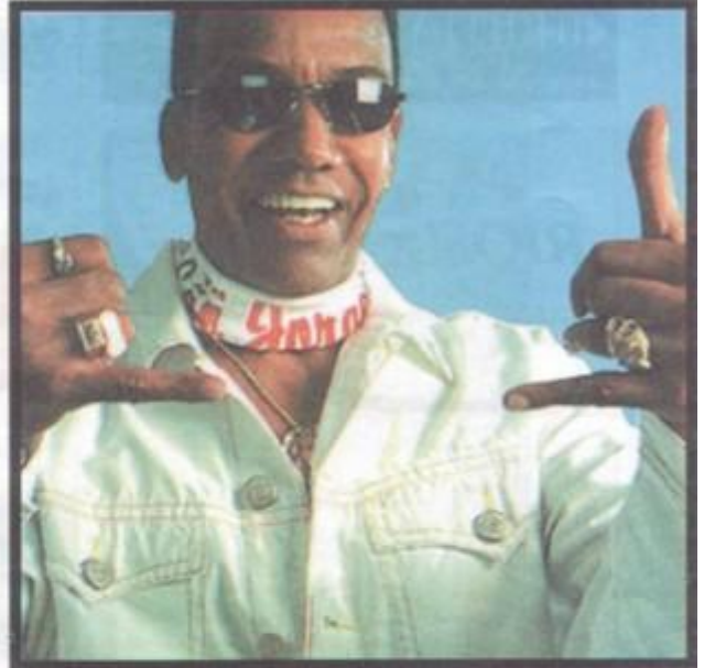
Jorge Ben Jor se apresenta no Camping Show no sábado

Amante declarado de mulheres e futebol (é flamenguista), Jorge Ben Jor se diz ansioso para a Copa. "Inclusive estarei lá na Alemanha fazendo show", conta. Mas, por outro lado, se recusou, curiosamente, a revelar a idade. "Pergunta inteiramente indiscreta! Tenho 33, a idade de Cristo. Quero continuar cantando e viajando levando a música para todos que gostam. E o futuro a Deus pertence!", arremata. Ingressos a R$ 20,00 (pista) e R$ 40,00 (mulheres/camarote) e R$ 50,00 (homens/camarote). Pontos de Venda: Discoteca 2001, Pizzaria Dom Bosco e faculdades do DF.