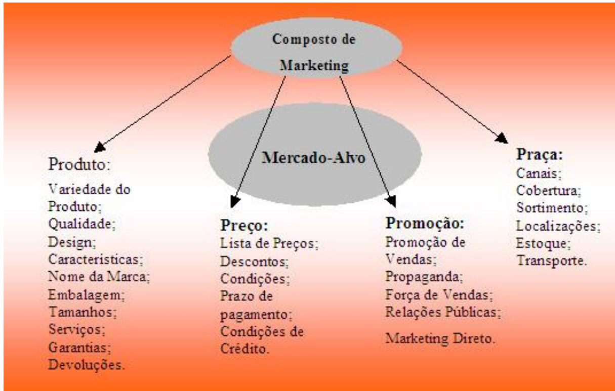
Figura 1.0 – Os Quatro P's do Composto de Marketing