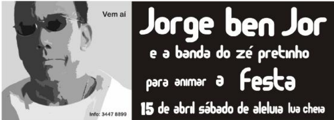
Figura 3 – Teaser