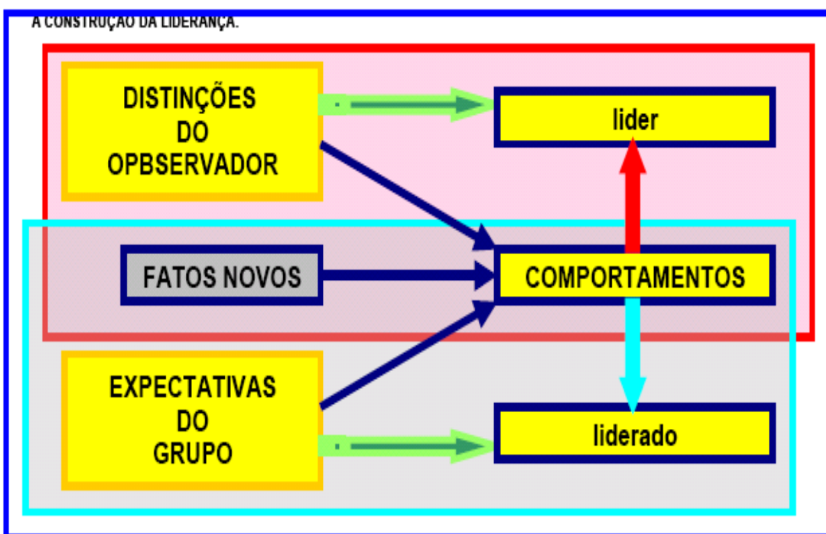
Figura 01 – Construção da Liderança

A respeito da ação comportamental do líder e do liderado, a liderança pode ser construída. Para que isso se evidencie, é necessário destacar os três elementos básicos: distinção do observador, as expectativas do grupo e os fatos novos. Os três elementos que se apresentam inter-relacionados são observados em relação a maneira de agir tanto do líder quanto do liderado em função de um fato novo. Pode-se identificar esse tipo de construção de acordo com a figura abaixo. (REIS, 2006).