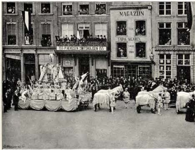
69.005. Mariafeesten te Roermond, 15 augustus 1885

grootte van zijn achterban konden voldoende middelen worden gegenereerd om in de nieuwe techniek van Meisenbach te investeren. De moderne uitgeverij van Henri Bogaerts werkte al sinds 1871 met technieken om foto's op houtblokken te reproduceren. Hoewel de KI de techniek van de autotypie wat later en met nog minder ophef introduceerde dan Eigen Haard , werd zij vanaf 1885 wel een vast onderdeel in de productie van het blad, naast de houtgravure. Beide technieken stonden tot omstreeks 1900 nog zij aan zij.