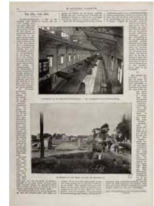
69.004. Pagina uit KI 19 (1885/1886) met autotypieën de Franse reuzenboom en de brand in Raamsdonk

222-223 in het blad Eigen Haard , dat zich richtte op een vooruitstrevend en protestants-christelijk publiek. 13 Er werd een vergelijking gemaakt tussen de traditionele houtsnede en de nieuwe techniek, waarvoor Meisenbach waarschijnlijk zelf het cliché had geleverd. Beide voorbeelden toonden een zeegezicht. De nieuwswaarde zat in de weergave van de nieuwe techniek, niet in de afgebeelde scènes. Ondanks deze primeur zette Eigen Haard de techniek de daarop volgende jaren nog niet in en bleef men de voorkeur geven aan de houtgravure. Met een oplage van ongeveer 6.000 rond 1880, was investeren in de nieuwe techniek voor het blad vooralsnog een te gewaagde onderneming. Het in 1867 opgerichte en in Den Bosch uitgegeven weekblad Katholieke Illustratie (KI) haalde daarentegen in diezelfde periode een oplage van 25.000 tot 30.000 exemplaren. Qua oplagegrootte kon dit blad zeker een vergelijking doorstaan met zijn buitenlandse voorbeelden, zoals het Franse l'Illustration . 14 De KI diende dankzij haar succes zelf weer als voorbeeld voor andere geïllustreerde tijdschriften in Nederland. 15 Doel van de KI was opvoeding van het katholieke volksdeel door middel van passende artikelen over kunst, poëzie, landen, volkeren én 'merkwaaardige gebeurtenissen en personen'. De totdan toe on-Nederlandse oplagen toonden het succes van de emancipatie van katholiek Nederland. Door de