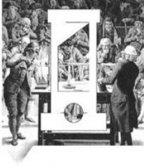
Het logo van het tijdsvak 'De tijd van pruiken en revoluties met links op de achtergrond het schilderij van Delacroix en rechts de definitieve versie met de afbeelding van de proef met een elektriseermachine.