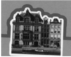
Het venster 'De Grachtengordel' met links de eerste versie, met het 19 e eeuwse gebouw van het NIOD en recht de verbeterde afbeelding met gebouw van het Bijbels museum.