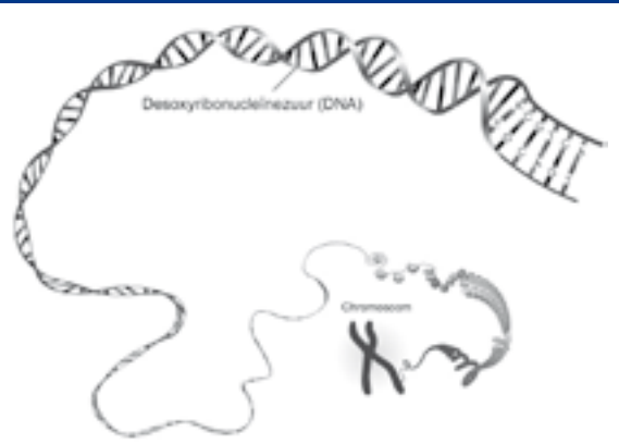
Figuur 1 Een chromosoom met daarin verpakt een dubbelstrengs DNA-molecuul in de vorm van een dubbele helix.

Een nucleotide bestaat uit een desoxyribosegroep (dat staat voor suiker) en een fosfaatgroep, die samen de ruggengraat vormen van een enkele DNA-streng (figuur 2). Daarnaast zit aan de suikergroep een van vier mogelijke stikstofhoudende basen verbonden: adenine (A), thymine (T), cytosine (C) of guanine (G), wat resulteert in vier verschillende soorten nucleotiden. De twee DNA-strengen worden bij elkaar gehouden omdat de basen van tegenover elkaar liggende nucleotiden via waterstofbruggen basenparen vormen. Adenine bindt altijd met thymine en cytosine altijd met guanine. De basenvolgorde van een enkele DNA-streng kan dus direct afgeleid worden van de tegenoverliggende streng, omdat deze complementair is. Gewoonlijk wordt de volgorde van dubbelstrengs DNA dan ook