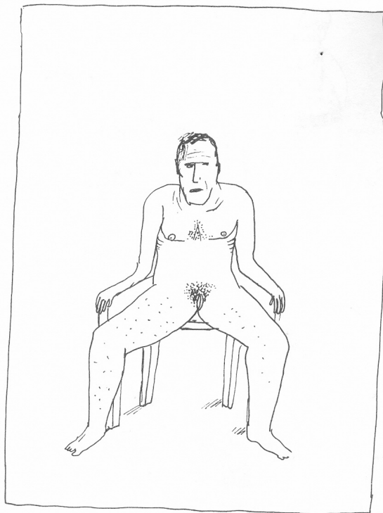
ZELFPORTRET MET ANDERMANS KUT