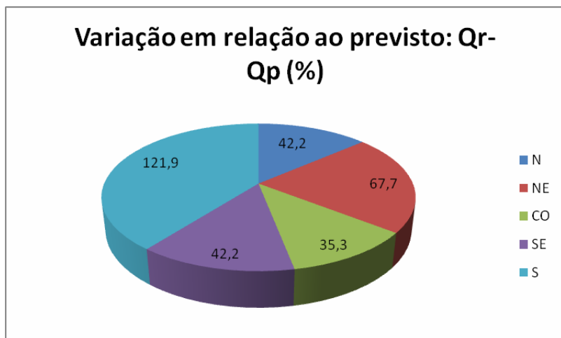
Fig. 1. Variação percentual entre a quantidade de resíduos previstas e retiradas das Unidades da Embrapa, por região do Brasil.

Na figura 1, pode ser observado que a diferença entre o passivo previsto e o efetivamente retirado foi menor na região Centro-Oeste (35,3%) quando comparada às regiões Nordeste (67,7%) e Sul (121,9%).