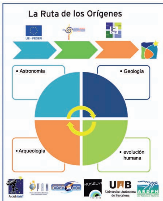
Figura 2. Participantes, organismos que han concedido la ayuda y ejes temáticos abordados dentro del proyecto Orígenes.

Dentro de las líneas prioritarias referidas a los orígenes históricos, el eje más destacado del proyecto se centra en la