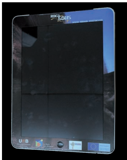
Figura 4. Detalle de la tableta digital utilizada a lo largo de la visita.