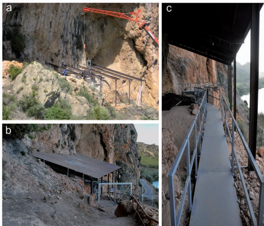
Figura 3. Adecuación y protección del yacimiento para el acceso público: a) obras de instalación de cobertura; b) aspecto del yacimiento tras la instalación de las infraestructuras de protección, y c) detalle de las pasarelas que facilitan la circulación del público a lo largo de la visita.

La protección del yacimiento y la creación de infraestructuras que hacen posible su visita han permitido adoptar un nuevo modelo, tanto de investigación como de divulgación científica, que se basa en el concepto work in process . Este planteamiento dinámico no solo pone el yacimiento al alcance de los visitantes, sino también la propia excavación. La instalación de pasarelas y rampas de acceso, así como la habi-