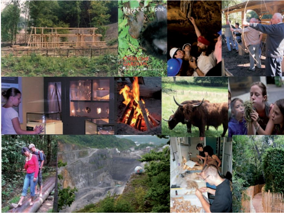
Figure 5. Patchwork visuel des trois thèmes et des deux manières de voyager qu'offrira le futur musée. Le Préhistosite entend bien se reformuler sans renier ce qui a fait sa typicité pendant près de vingt ans.

gigantesque bond dans le temps, à l'époque des dinosaures où l'homme n'existait pas. C'est l'occasion de comprendre comment s'est formé le calcaire, puis la grotte et de découvrir enfin le site archéologique.