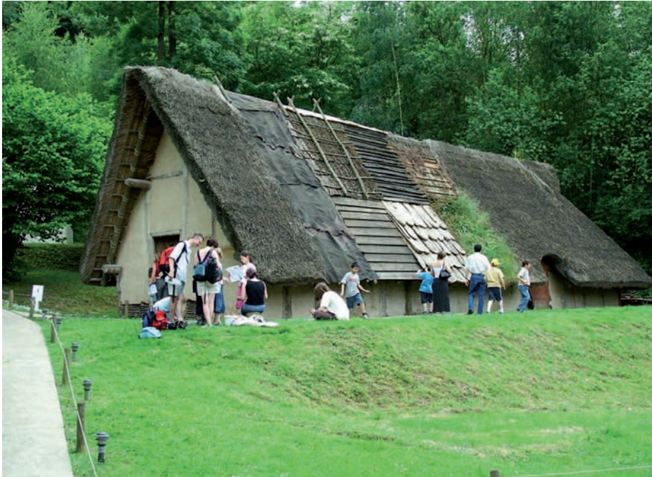
Figure 4. La reconstitution de la «maison 3» du village Néolithique ancien de Darion (7.000 ans, province de Liège, Belgique) montre simultanément plusieurs hypothèses de construction. Les visiteurs perçoivent la reconstitution comme un objet de synthèse d'hypothèses et non comme une réalité préhistorique.

Le Musée-Médiateur se doit d'expliquer son processus de patrimonialisation et de recherche de manière à rendre compréhensible pour tout un chacun le «point de vue» qui détermine tous ses choix et ses actions. Le making off est une des bases déontologiques (Collin, 2001-2002) (figure 4)