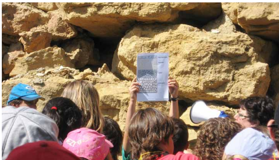
Figura 6. Explicacions durant l'itinerari realitzat des del Coll d'Àger fins a la població, tot seguint l'antiga via romana.

La valoració per part dels alumnes és molt bona, s'han adonat que tenen a prop monuments tan importants o més que els que estudiem als llibres de text. Els mestres també ho valorem molt positivament, ja que ens ha servit per assolir uns aprenentatges amb els alumnes d'una manera molt més participativa. Les famílies i els ajuntaments també han expressat la seva satisfacció pel fet que valoréssim algun element del seu poble i, a més a més, els pares estan molt satisfets amb l'interès que mostren els seus fills pel projecte i els resultats dels treballs.