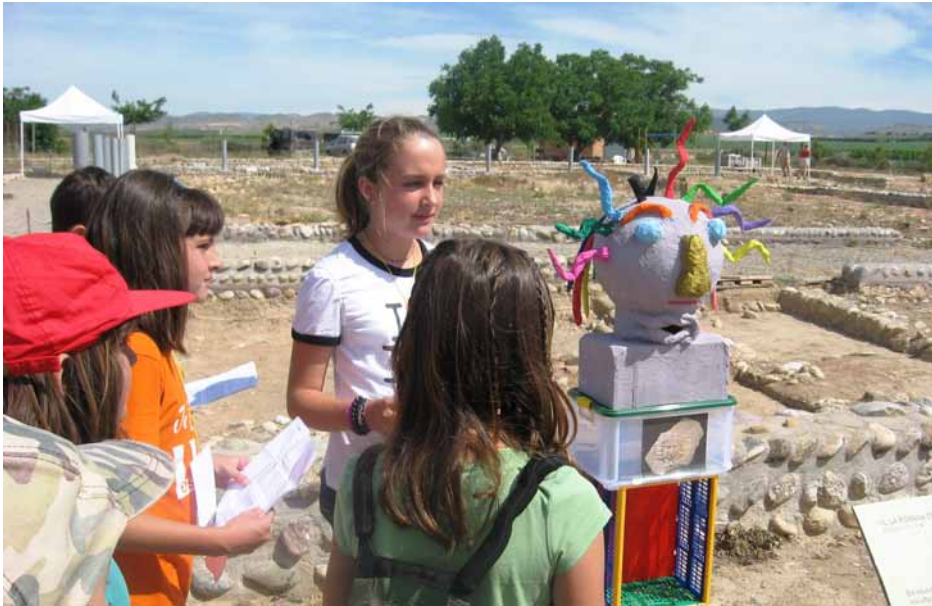
Figura 4. Visita guiada al jaciment de la Vil·la Romana del Romeral. Un capgròs de la Medusa presidia la visita.

Per poder ubicar cada mosaic i per realitzar el projecte, els alumnes de l'escola van visitar diverses vegades la vil·la, escoltant les explicacions de l'alcalde i de l'arqueòleg de l'excavació. També van realitzar diversos assaigs, explicant tots els detalls, les estances i les curiositats de la vil·la als seus companys de cinquè, abans de realitzar-ho amb els alumnes d'altres escoles (Figura 4). Han après, per exemple, que el tipus i la qualitat d'un mosaic d'una cambra ens indicarien quina mena d'estança era, ja sigui per la perfecció de les cel·les o la seva riquesa, o si pertanyia a una família benestant, si era l'habitació del senyor de la casa, etc. Tot aquest aprenentatge va ser recollit en un tríptic que van dissenyar i que els va permetre difondre els coneixements obtinguts més enllà de l'escola, als seus familiars i a la resta de la població d'Albesa.