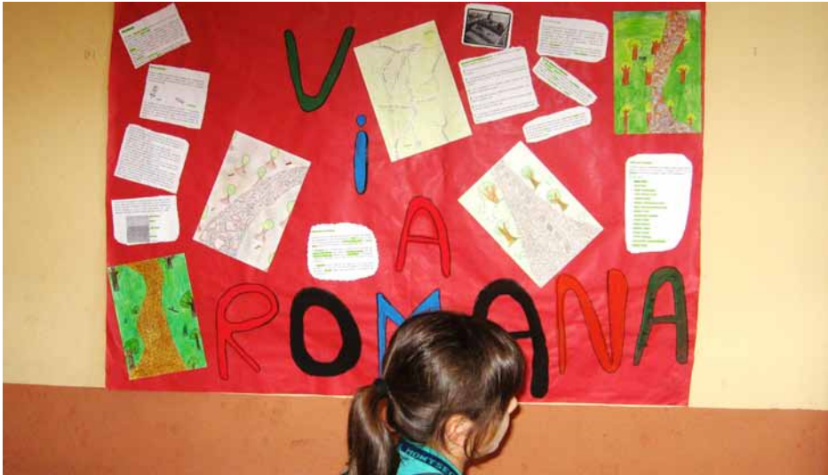
Figura 7. Exposició dels materials elaborats pels alumnes de la ZER del Montsec al voltant de la Via Romana.

xements útils des d'una perspectiva de vida en col·lectivitat (Figura 6).