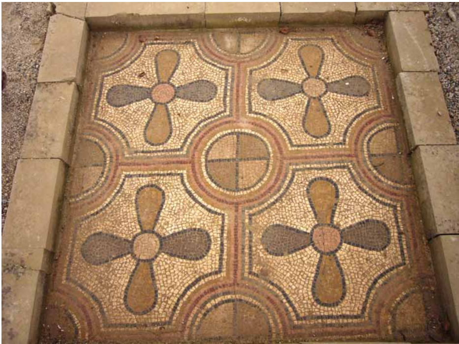
Figura 2. La festa del Patrimoni a m.

Aquest és un projecte en què s'ha implicat, a més a més dels diferents estaments del centre, bona part de la comunitat de l'entorn. Concretament hem estat