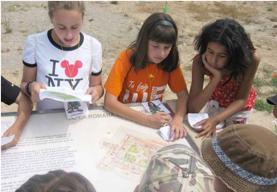
Figura 5. Nens i nenes de la ZER del Montsec escoltant les explicacions de l'«experta» de l'Escola l'Àlber.

L'experiència del curs passat, motiu de la presentació d'aquesta comunicació, va tenir una rellevància especial. La ZER del Montsec va adoptar la Via Romana d'Àger. Això va permetre conèixer el sistema de comunicacions en època romana i comparar-la amb el sistema de comunicacions a la Catalunya actual. El «grup d'experts» del nostre centre, l'alumnat de cicle mitjà i superior, es va encarregar d'explicar aquest element patrimonial als nens i les nenes de l'escola l'Àlber d'Albesa en una jornada que va acabar amb un dinar conjunt a la població d'Àger, després de visitar també el sarcòfag romà que es troba a l'interior de l'església de Sant Vicenç (Figura 5).