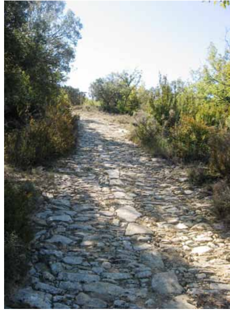
Figura 3. Tram força ben conservat de la via romana d'Àger.

Una activitat especialment significativa va ser la presentació de la vil·la als alumnes de la ZER del Montsec. L'alumnat es va prendre la realització d'aquesta activitat amb moltes ganes d'aprendre per tal de poder explicar aquestes restes històriques a la seva família i amics, se'ls veia entusiasmats i és molt positiu el fet de poder-ho explicar als companys d'altres centres. Tot això els ha representat perdre la vergonya, dominar el nerviosisme i, al mateix temps, per fer-ho correctament i sense equivocacions, haver de dominar el que explicaven, havent de respondre les preguntes que els feien sense dubtar