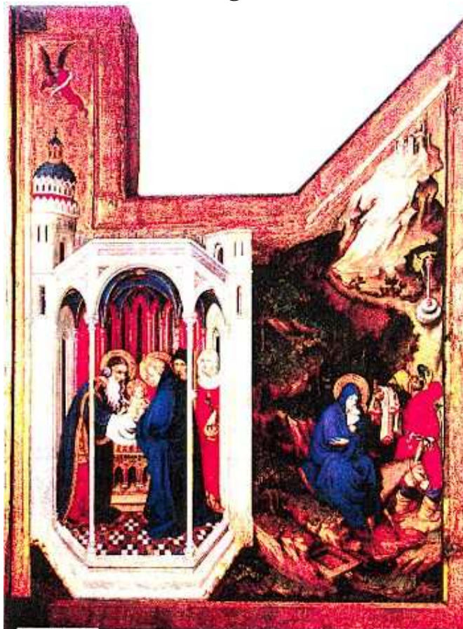
Melchor Broederlam, Diptico de Dijon, Museo de Dijon, Francia, ca. 1395, Presentación en el Templo, Huida a Egipto pintado sobre madera

En la cima del monte rocoso hay un castillo que obedece a una descripción concreta que de él hacen los Apócrifos: