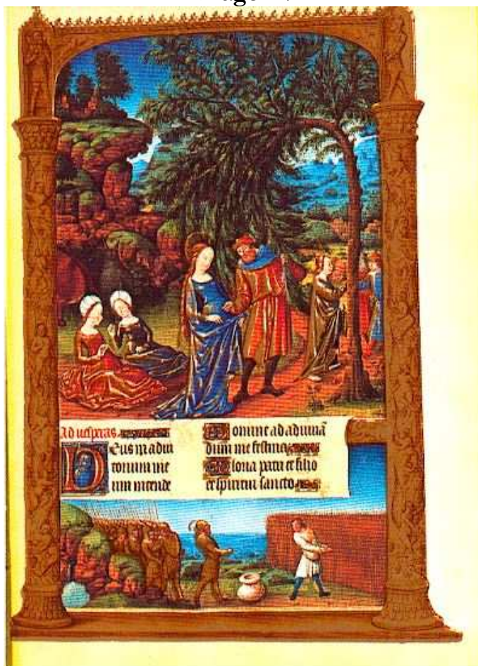
Jean Colombe, Las muy ricas horas del Duque de Berry, 1485-1489, Museo Condé, Chantilly, Folio 57, 29 x 21 cm.