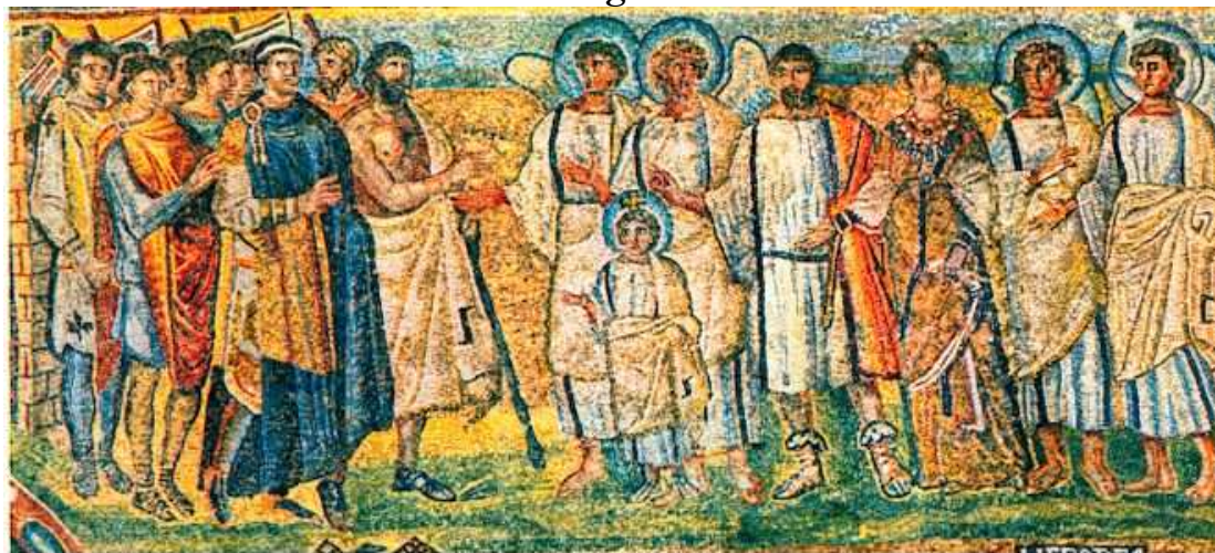
Santa María Mayor, Roma, 432-440, arco triunfal del ábside, Encuentro entre el rey Atradesis y Cristo, mosaico.

La Virgen aparece con la majestad de una emperatriz bizantina, San José semeja un togado funcionario romano, y el Niño Jesús se reviste con todos los atributos de la dignidad real y presenta, como indicación de su divinidad, una forma no común de nimbo crucífero, un halo con una pequeña cruz dorada por encima de su cabeza.