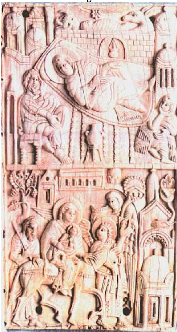
Paliotto de Salerno, Catedral de Salerno, c. 1084. Natividad y Huida a Egipto, marfil de elefante, . perlas negras, 24 cm,

La parte inferior de la placa ilustra la Huida a Egipto, o más bien, la entrada a la ciudad egipcia de El Cairo, tal como se relata en los Evangelios Apócrifos. El artista ha reproducido con gran fidelidad la mezquita de Ibn Tulun en El Cairo, edificio terminado en 879. María y el Niño están sobre una mula ricamente enjaezada a la manera oriental. San José cierra la marcha y coloca una mano sobre la mula, gesto que repite la Virgen. San Rafael Arcángel,