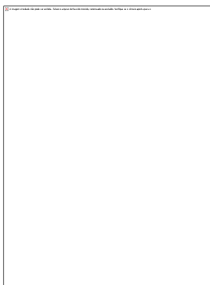
PRANCHA - 3

"Na direção em que o sul se inclina para o sol poente, a Etiópia é a mais remota das regiões habitadas; existe muito ouro e há enormes elefantes, e todas as árvores silvestres, e ébano, e homens de elevada estatura e muito belos e de uma longevidade excepcional (HERÓDOTO, III, 114)