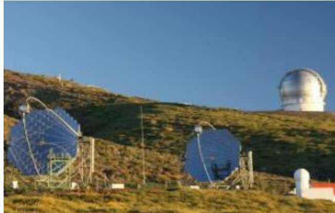
El sistema de telescopi MAGIC situat al Roque de los Muchachos, Illes Canàries, en funcionament des de 2003.

04/2013 - Física. L'octubre de 2003, diversos representants de les institucions europees juntament amb un grup de científics van inaugurar el primer telescopi MAGIC. Aquest projecte va néixer d'una col·laboració entre alguns instituts europeus, majoritàriament espanyols, italians i alemanys. El projecte es va iniciar a partir de la voluntat dels científics d'utilitzar noves idees i solucions tecnològiques, el que va conduir a la construcció del telescopi de raigs gamma amb el llinar d'energia més baix i temps de reposicionament més ràpid del món, la qual cosa ha fet possible èxits científics molt importants. Investigadors de la UAB han participat en MAGIC des del seu inici.