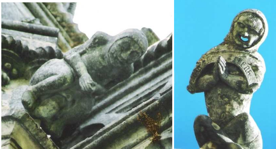
Gárgula freira da Igreja do Convento da Nossa Sr a da Conceição de Beja (imagem à esq.) datada da 2 o metade do séc. XV e gárgula das Capelas Imperfeitas do Mosteiro de Santa M a da Vitória, Batalha (à direita), finais séc. XV, inícios da centúria seguinte.