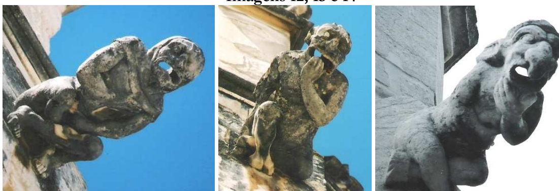
Imagens 12, 13 e 14

Gárgulas cujos órgãos ligados aos sentidos foram acentuados plasticamente: à esquerda e centro, duas gárgulas das Capelas Imperfeitas, Mosteiro de Sta. Maria da Vitória, Batalha, dtadas dos finais séc. XV, inícios séc. XVI, à direita gárgula da Ermida de S. Jerónimo, Belém, Lisboa, datada dos inícios séc. XVI. De referir o capuz do hábito religioso na gárgula mais à esquerda, indício que nem os religiosos estavam imunes às tentações decorrentes dos sentidos e que faziam pecar (esta gárgula não é caso único no edifício, com quase duas centenas de gárgulas).