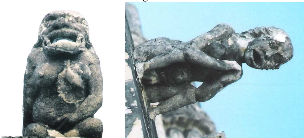
Gárgula da Igreja da Nossa Sr a do Pópulo, Caldas da Rainha (imagem à esq.), datada dos primeiros anos do séc. XVI e gárgula das Capelas Imperfeitas do Mosteiro de Santa M a da Vitória, Batalha (à direita), finais séc. XV, inícios séc. XVI.