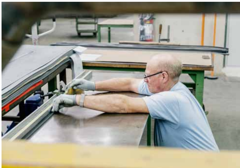
Eine Mehrheit der entlassenen Industriearbeitenden hat intakte Beschäftigungsperspektiven. Am meisten Mühe mit der Wiedereingliederung bekunden ältere Arbeitnehmende.

Welche beruflichen Aussichten haben Industriebeschäftigte in der Schweiz, die im Rahmen einer Betriebsschliessung entlassen werden? Eine Erhebung der Universität Lausanne zeigt, dass zwei Jahre nach der Entlassung über zwei Drittel der Betroffenen wieder eine Stelle gefunden haben. Insbesondere ältere Arbeitnehmende hatten im Nachgang von Betriebsschliessungen grosse Mühe, eine Stelle zu finden. Nach Betriebsschliessungen stellt ein fortgeschrittenes Alter offenbar einen grösseren Nachteil dar als eine fehlende Ausbildung.