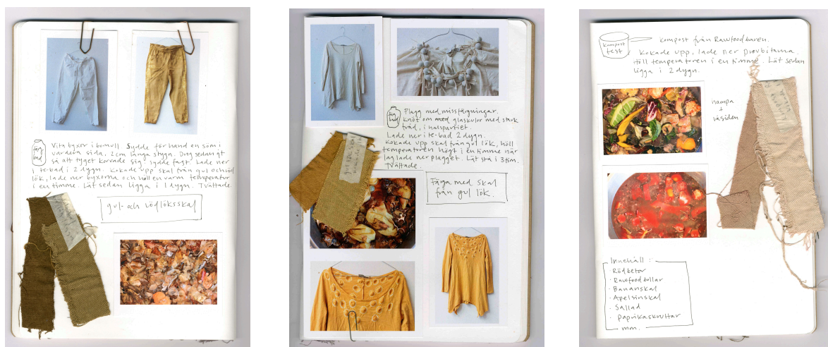
Sidor i min arbetsbok

lortigt ut eller att reservagemetoden inte fungerade. Men jag bestämde mig för att låta alla resultat få ta plats i min undersökning eftersom de i allra högst grad var en lärdom.