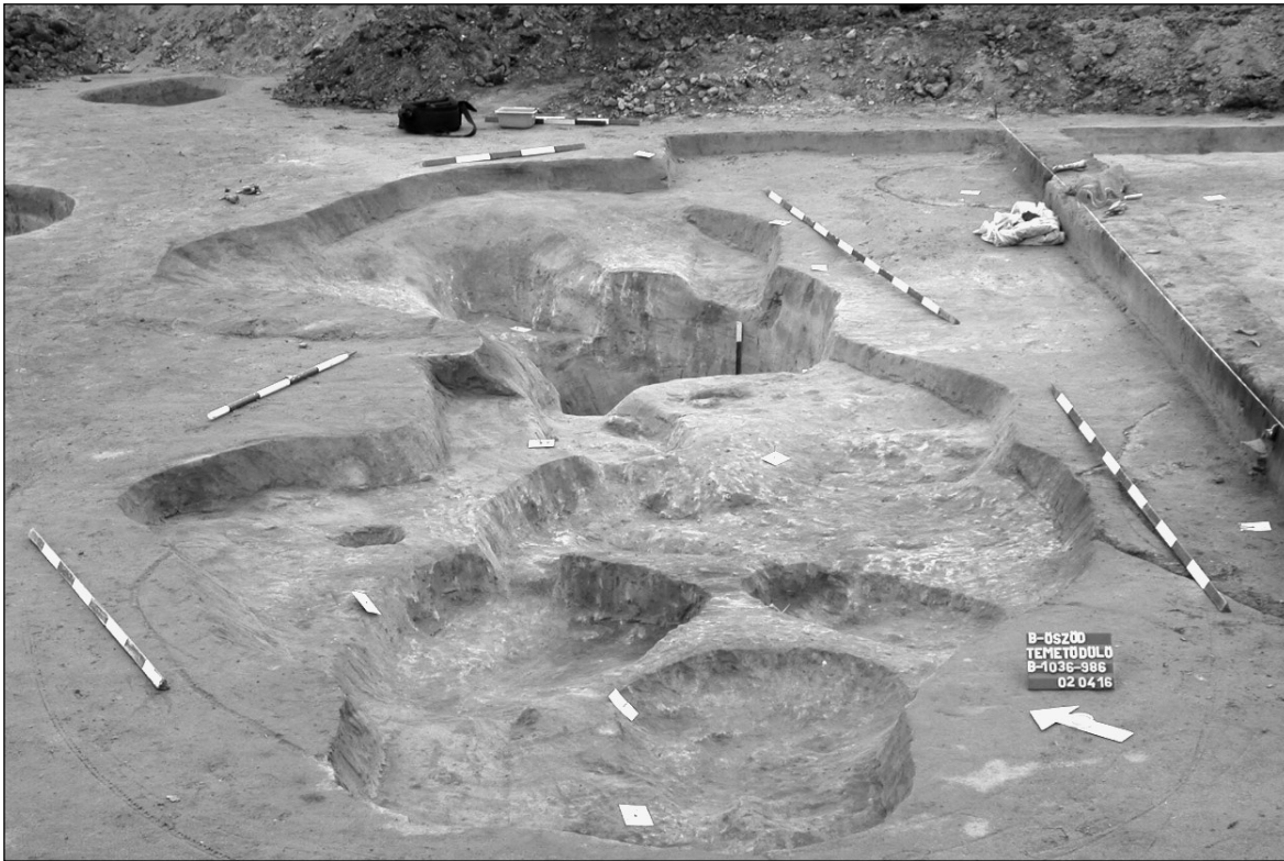
2. kép. Balatonőszöd – ásatási felvétel az „áldozati helyről” Fig. 2. Balatonőszöd – photo of the “ritual place”

rákban később ötszögletű álarc arcvonások nélküli; teljességében lefedti, eltakarja az emberi arcot. Csak az arc területére terjed ki, minden esetben – általában a füleknél – átfúrással rögzíthető. A fej általában hátracsapott, előfordulhat a szem és a száj bekarcolással való jelzése, az orr plasztikus kiemelése. Nemük legtöbbször nincs jelölve, ahol igen, (főleg a késő neolitikumtól) ott a legtöbbször a másodlagos nemi jegyek alapján nőneműek; egy esetben – a szegvár-tűzkövesi ún. „sarlós isten” (MAKKAY 1978, 164–184) – biztosan férfit ábrázolnak. Szegvár-Tűzkövesről ismerünk egy fej nélkül előkerült „baltás” idoltorzót is, melynek emlői és férfi nemi szerve is van (TROGMAYER 1992, 57–62). Elképzelhető, hogy az alak hermafrodita, bár a mellék meglehetősen apró dudorok, akár férfié is lehetnek. Attribútuma – balta – inkább férfit sejtet.