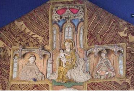
Fig. 7. Madone entre Saint Louis et saint François, 31 e chasuble, Trésor de la Cathédrale d'Esztergom

bouquet de blé et de palme, entouré d'une couronne de plumes. Au dessous de la Madone, on voit sainte Catherine d'Alexandrie, sainte Dorothee et sainte Anne avec la Vierge Marie et l'Enfant Jésus.