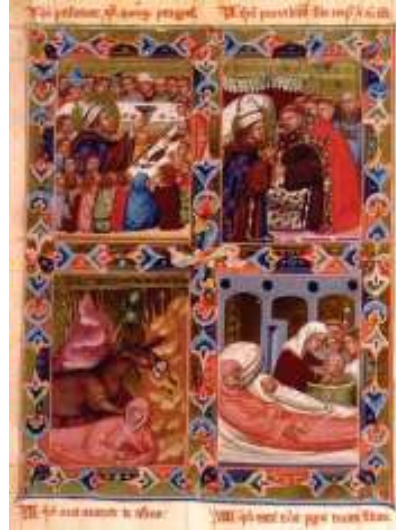
Fig. 3. Scènes de la vie de saint Louis de Toulouse, Légendaire hongrois angevin , Bibliothèque Apostolique Vaticane

ont dès lors survécu. Il nous reste toutefois le sceau du monastère avec l'inscription: «S(IGILLUM) FR(AT)RIS QVARDIANI DE C(ON)VENTU S(ANCTI) LUDOVICI» (fig. 1). 8 L'église baroque reconstruite vers 1756 ne conserve plus la mémoire du saint. C'est probablement Louis Ier le Grand, fils de Charles Robert d'Anjou qui fonda la chapelle dédiée à saint Louis dans la basilique de Székesfehérvár, lieu de couronnement et de sépulture des rois de Hongrie. Cette chapelle est mentionnée dans les chartes à partir de 1395, ainsi elle aurait aussi pu être fondée par Sigismond de Luxembourg ou la reine Marie son épouse, fille de Louis le Grand.