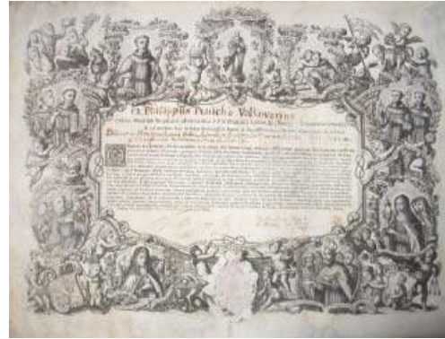
Fig. 12. Diplôme imprimé du monastère de Vukovar, collection de Dénes Csongor

Outre la gravure publiée dans le livre de Hevenesi (fig. 9), j'ai retrouvé deux autres exemples de gravures sur cuivre représentant saint Louis aux XVII et XVIIIe siècles. La première illustre un miracle de saint Louis (fig. 11), pour les Fasti Mariani de Andreas Brunner, publiés à Munich en 1630. Elle fut ensuite aussi diffusée en tant qu'image sainte de dévotion en Hongrie. 33 Pendant mes recherches pour éclairer le culte de Saint Louis en Hongrie, j'ai trouvé dans la collection privée de Dénes Csongor une gravure (fig. 12) qui n'est autre qu'un diplôme imprimé du monastère de Vukovar (aujourd'hui en Croatie), de la province franciscaine Jean de Capistran, fondée en 1757. 34