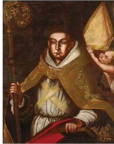
Fig.16. Saint Louis, Galerie Nagyházi

saint Louis de Toulouse et celle de saint Bonaventure entourent le tableau, dû à Johann Lucas Kracker, du maître autel de l'église saint Antoine des frères mineurs conventuels construit à Eger entre 1745-1758 selon les projets de Kilian Ignaz Dietzenhofer (fig. 15). 40 Les deux œuvres, en stuc, sont de la main de József Hebenstreit vers 1770. Outre la peinture de la Galerie Nationale de Hongrie déjà mentionnée, plusieurs tableaux du XVIIIe siècle représentent saint Louis, par exemple l'image d'origine inconnue de la Galerie Nagyházi (fig. 16). 41