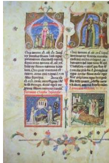
Fig. 4. Deux épisodes liés à saint Louis, Chronique Enluminée

Ce culte se manifeste de diverses façons sur les miniatures. Deux pages du codex enluminé appelé généralement Légendier hongrois angevin créé vers 1330-40 par un atelier bolonais pour une commission provenant de la cour royale hongroise, représentent les scènes de la vie de Saint Louis de Toulouse (figg. 2-3). 12 Chacune de ces pages contient quatre images et les scènes sont expliquées par un court titre en latin. La légende de saint Louis suit directement celle de saint François d'Assise. Les huit scènes du Légendier sont l'une des premières représentations détaillées de la vie de saint Louis.