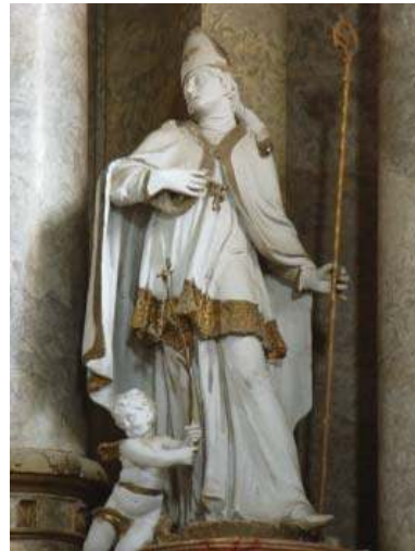
Fig. 15. Saint Louis de Toulouse, maître autel de l'église saint Antoine, Eger

Lajos Lengyel en 1747 pour l'église franciscaine éfidiée à Andocs entre 1743-1767. 5. Sa statue, avec saint Bonaventure, se trouve sur l'autel de saint François sculpté par Antal Alter et József Hebenstreit en 1755 pour l'église franciscaine reconstruite à Szécsény vers 1715-1716. 37 6. Faisant toujours paire avec saint Bonaventure, elle apparaît sur l'autel de saint François sculpté par le même sculpteur, József Hebenstreit, quatre ans plus tard, en 1759 pour l'église franciscaine reconstruite à Gyöngyös en 1718. 38 Du monastère lié à cette église provient également une peinture représentant saint Louis, conservée aujourd'hui à la Galerie Nationale de Hongrie à Budapest. 39 Elle est l'œuvre d'un maître viennois de la deuxième moitié du XVIII e siècle. 7. La statue de