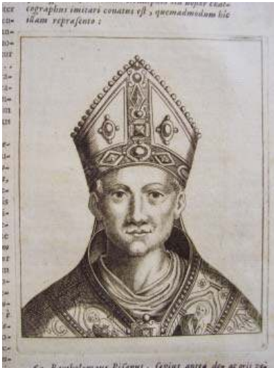
Fig. 10. JOANNE BAPT. SOLLERIO, Acta sanctorum , Antwerpen, 1737.