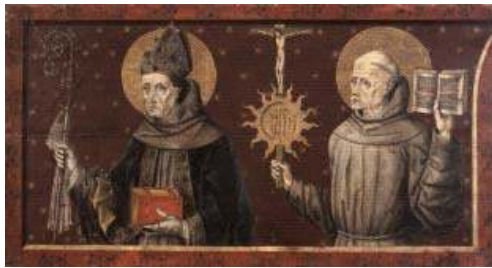
Fig. 6. Saint Louis de Toulouse et saint Bernardin de Sienne, prédelle, Musée des Beaux Arts de Budapest

Il est présent sur le fragment de prédelle conservé au Musée des Beaux Arts de Budapest, peint par un peintre autrichien en 1477 (fig. 6). 22 Saint Louis est cette fois entouré de saints franciscains: saint Antoine de Padoue, saint François et saint Bernardin de Sienne. 23