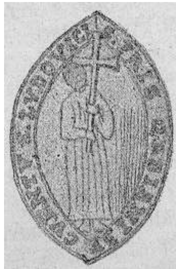
Fig. 1. Sceau du monastère franciscain à Lippa

On peut repérer la vénération du saint en Hongrie dès sa canonisation en 1317, et d'abord comme culte dynastique au sein de la famille royale, qui s'exprime de diverses façons. Au XIVe siècle, nombreux étaient les sanctuaires où l'on vénérât saint Louis de Toulouse. Le centre du son culte se trouvait à Lippa (Lipova, aujourd'hui en Roumanie) et y resta pendant deux cents ans. Le roi Charles Robert y fonda une église et un monastère franciscains en 1325. 6 La reine Elisabeth laissa un calice d'or à ce monastère par testament en 1380. 7 Les bâtiments furent détruits pendant l'occupation turque, et peu de traces matérielles documentant le culte du saint