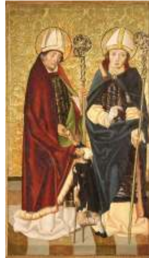
Fig. 8. Saint Louis et Saint Valentin, Musée Chrétien, Esztergom

Ce sont précisément des ouvrages jésuites, mais aussi le décor des églises franciscaines, qui permettent de retrouver des traces du culte de saint Louis de Toulouse après la domination turque des XVI e et XVII e siècles. La vénération du saint dans la famille royale des Habsbourg n'est pas attestée. Aux XVII e et XVIII e siècles, les jésuites proposèrent en exemple la vie de saint Louis aux jeunes étudiants du séminaire et de l'université de Nagyszombat (Trnava). Les livres la prenant pour thèmes sont nombreux, par exemple Maria Mater Agonizantium du jésuite János Nádas, dont la première