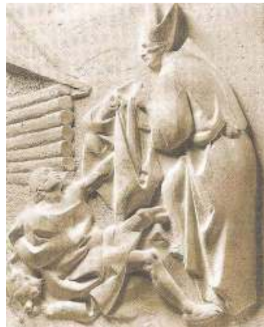
Fig. 18. László Marton: Saint Louis donnant son manteau à un indigent, chapelle de Notre Dame des Hongrois de Rome, église inférieure de la basilique Saint-Pierre, Rome

renforcer la légitimité de leur famille en Hongrie. Pendant cinq siècles, saint Louis est généralement représenté frontalement avec les mêmes traits: jeune, portant la bure franciscaine et les attributs épiscopaux: la crosse, la mitre et quelquefois un livre. Au XVIII e siècle, la figure du saint Louis est mise en relation avec celles des saints franciscains, surtout de Saint Bonaventure. Durant tous ces siècles, saint Louis fut donc continuellement présent dans l'histoire hongroise, où il avait un rôle symbolique. Dès sa canonisation, sa figure se prêta à de nombreuses actualisations en fonction des exigences politiques du pouvoir en place. Pour aller plus loin dans la compréhension du culte de saint Louis, il faudrait s'intéresser encore à la liturgie et à la musique, et approfondir nos connaissances concernant le culte et les représentations artistiques aux XIX e et XX e siècles.