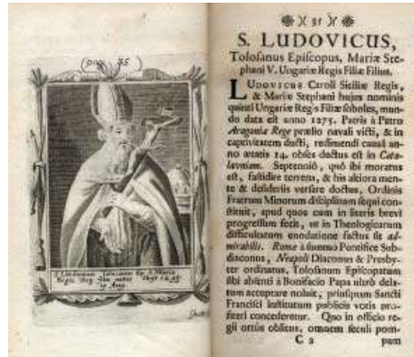
Fig. 9. GABRIEL HEVENESI, Ungaricae sanctitatis indicia , Nagyszombat, 1692

Quarante ans plus tard, en 1692, un autre jésuite, Gábor Hevenesi publiait un recueil de vies des saints hongrois, intitulée Ungaricae sanctitatis indicia , à Nagyszombat (Trnava). Chaque courte biographie de deux pages est illustrée par une gravure représentant le saint dont il est question. C'est le cas de saint Louis de Toulouse (fig. 9). 27 Dans une autre œuvre intitulée Flores quotidiani et publiée à Vienne en 1714, Gábor Hevenesi donne pour