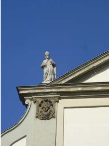
Fig. 14. Saint Louis, façade de l'église de saint Pierre d'Alcantara, Budapest

de Jakab Hans. La façade a été terminée en 1740. 2. Deux statues de saint Louis de Toulouse et de saint Rainard flanquent l'autel latéral de saint Dominique dans l'ancienne église dominicaine de Sopron. 36 Une tradition veut qu'elles aient été exécutées par un certain frère Dominique vers 1740. 3. Saint Louis apparaît également sur la façade d'une autre église franciscaine construite à Budapest entre 1727 et 1743 et dédiée à saint Pierre d'Alcantara (fig. 14). On le voit parmi d'autres saints sur la partie haute: saint Bonaventure, saint Benvenuto et saint Roch. 4. Saint Louis de Toulouse figure parmi les trois prédicateurs franciscains, saint Jean Capistran, saint Bonaventure et saint Bernardin de Sienne sur la chaire sculptée par