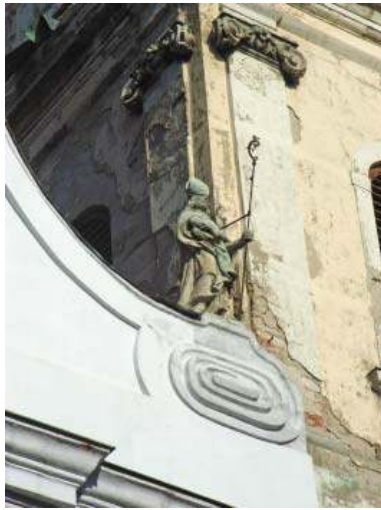
Fig. 13. Saint Louis de Toulouse, façade de l'église des Stigmates de Saint François d'Assise, Budapest

Le diplôme a été rempli au nom de Fülöp Penić, le premier supérieur de la province, le 1er juillet 1760. Le texte est entouré par les représentations de saints franciscains, entre autre saint Louis faisant paire avec saint Bonaventure en haut à gauche.