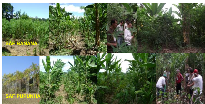
Fig. 1 e 2. Evolução do SAF BANANA e SAF PUPUNHA.