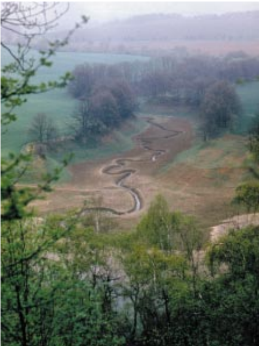
Trockengefallener periodischer See (Bauerngraben)

Dieser Lebensraumtyp beinhaltet temporär wasserführende Karstseen inklusive periodisch wasserführender Erdfallseen. Die Gewässer bilden sich in Dolinen und Poljen, die über sogenannte Ponore (Schlucklöcher) mit zeitweise wasserführenden unterirdischen Hohlräumen verbunden sind. In Zeiten starker Wasserführung dieser Hohlräume tritt Wasser in der Doline bzw. im Polje aus, so dass es zur Seebildung kommt. Bei nachlassender Wasserführung des Hohlraumsystems läuft das Wasser wieder in die Hohlräume ab. Manche dieser temporären Gewässer verfügen auch über einen oberirdischen Zulauf, der zeitweise in den Klüften und Spalten an der Auslaugungsfront des Karstes verschwindet. Bei großem Wasserandrang kann der Ablauf des Wassers durch eine mehr oder minder wirksame Abdichtung des Seebodens mit Feinsediment oder Fallaub zeitweilig verzögert werden, so dass sich das Seebecken für kürzere oder längere Zeiträume füllt. Erdfallseen sind in den LRT mit eingeschlossen, wenn nicht eindeutig festzustellen ist, dass sie auf bergbauliche Aktivitäten zurückzuführen sind.