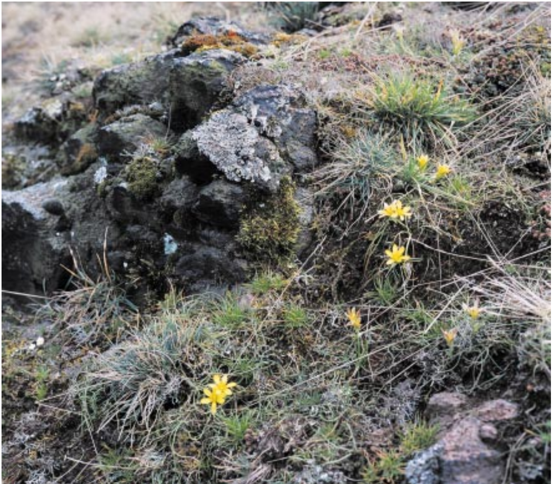
Felsen-Goldstern ( Gagea bohemica ) auf flachgründigem Silikatgesteinsboden im FFH-Gebiet Porphyrkuppenlandschaft nordwestlich von Halle

Auf flachgründigen, feinerdearmen Silikatgesteinsverwitterungsböden, die frühjahrsfrisch sind, vorkommend. Eine vorwiegend von einjährigen Pflanzen aufgebaute Pioniergesellschaft, die ihre Entwicklung bereits abgeschlossen hat, wenn die flachgründigen Grusstandorte im Frühsommer auszu-