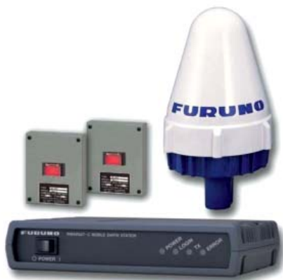
Slika 3. Osnovni elementi SSAS uređaja Figure 3 Basic elements of SSAS

Uređaj mora na brodu biti instaliran na dva različita mjesta. Jedan je smješten na samom zapovjedničkom mostu, dok je drugi smješten negdje tajno na nekom drugom mjestu na brodu, a to mjesto mora biti naznačeno u samom SSP-u. Iz razgovora sa svojim kolegama pomorcima saznajem da se navedeni drugi uređaj najčešće nalazi u kabini zapovjednika broda, dok postoje primjeri da se nalazi i na sasvim neobičnim drugim mjestima unutar nadgrađa broda. Za to mjesto znaju redovito zapovjednik i SSO, međutim vrlo često i ostali časnici pogotovo časnici službe palube.