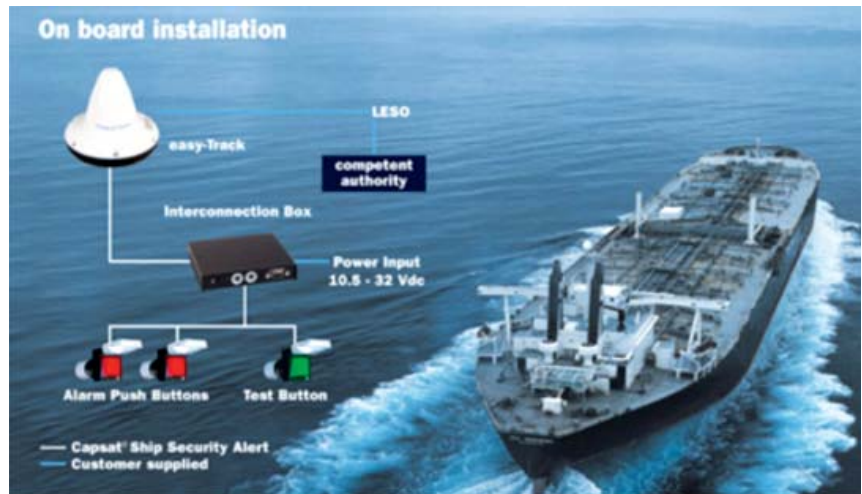
Slika 4. Prikaz instalacije SSAS uređaja na brodu Figure 4 SSAS on board installation

dakle (geografska širina i dužina), a ta se informacija dobiva preko GPS-a. Pored navedenog, također treba naglasiti da ovisno o proizvođaču uređaja način aktiviranja može biti različit, što je navedeno u uputama u SSP-u, u kojem postoje i upute o testiranju istog uređaja. Najčešća izvedba navedenog prekidača je uz posjedovanje preklopne zaštite da spriječi slučajno aktiviranje, dok postoje i uređaji gdje je u izbornik potrebno ubaciti odgovarajući tajnu šifru i onda se oslobađa opcija aktiviranja uzbune. Treba istaknuti da se aktivacijom ovog uređaja na brodu i u bližoj okolini neće ništa bitno dogoditi, dakle nema zvučnog alarma, a niti brodovi u dometu AIS uređaja neće moći zaprimati nikakve poruke. Zbog toga se u praksi ovaj uređaj često i naziva „Tihi alarm“.