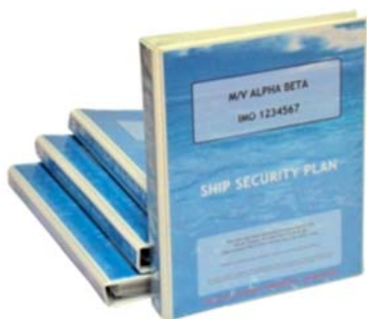
Slika 1. Ship Security Plan Figure 1 Ship Security Plan

Plan sigurnosne zaštite broda provode SSO i CSO. Po odredbama ISPS- kodeksa, plan mora sadržavati najmanje 19 zadanih poglavlja. On najčešće počinje s organizacijskim ustrojem broda, ovlastima ključnih osoba. Sadrži također načine redovne revizije ili prosudbe, odnosno izmjene ili dopune s obzirom na okolnosti. Posjeduje mjere namijenjene sprječavanju unosa ilegalnog oružja i opasnih tvari, popis mjesta s ograničenim pristupom, postupke za uvježbavanje, brodske i skupne vježbe, postupke vezane za sigurnosnu opremu.