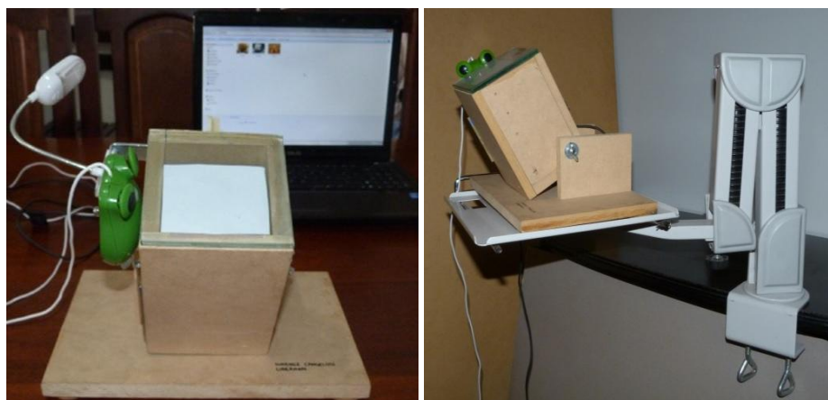
(a) Dispositivo final previo a la experiencia con usuarios.